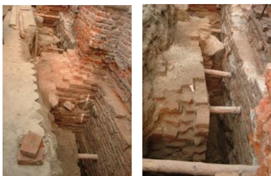
Ryc.12-13. Fundament kościoła pojezuickiego od strony ul. Ratuszowej. 2006 r.

W trakcie remontu schodów do ratusza w 2017 r. okazało się, że są one posadowione na murze wcześniejszej budowli, zapewne jednej z kaplic kościoła św. Mikołaja, rozebranych w latach 90. XVIII w. 11