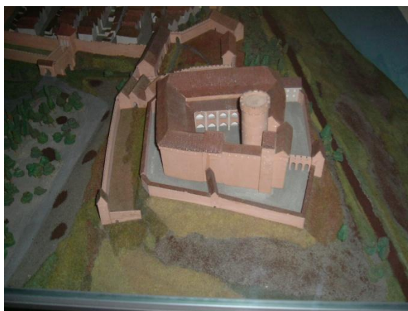
Ryc. 7. Zamek wysoki od strony północnej. Fragment makiety współautorstwa J. Frycza.

J. Frycz za poprzednimi badaczami przyjął, że miasto średniowieczne było lokowane na terenie Grudziądza w obrębie murów, w jego części północnej. Było to w pewnym stopniu nawiązanie do poglądów X. Froelicha. J. Frycza interesowały też zagadnienia urbanistyczne. Odnośnie rozplanowania miasta, obrysu murów J. Frycz zasadniczo nie wniósł nowych elementów. Powielił on plany rekonstrukcyjne wcześniejszych badaczy, w tym C. Steinbrechta. W przeciwieństwie do poprzednich badaczy J. Frycz podjął się próby rekonstrukcji zagospodarowania kwartałów na terenie miasta. W tym przypadku, wzorując się na planie Torunia z XVII w., (ryc. 8), przyjął zasadę, że wszystkie kwartały, z wyjątkiem rynków, były zabudowane kamienicami mieszczańskim 3 .