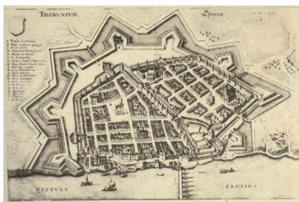
Rys. 8. Plan Torunia z XVII w. Za T. Petrykowskim.

J. Frycz za poprzednimi badaczami przyjął, że miasto średniowieczne było lokowane na terenie Grudziądza w obrębie murów, w jego części północnej. Było to w pewnym stopniu nawiązanie do poglądów X. Froelicha. J. Frycza interesowały też zagadnienia urbanistyczne. Odnośnie rozplanowania miasta, obrysu murów J. Frycz zasadniczo nie wniósł nowych elementów. Powielił on plany rekonstrukcyjne wcześniejszych badaczy, w tym C. Steinbrechta. W przeciwieństwie do poprzednich badaczy J. Frycz podjął się próby rekonstrukcji zagospodarowania kwartałów na terenie miasta. W tym przypadku, wzorując się na planie Torunia z XVII w., (ryc. 8), przyjął zasadę, że wszystkie kwartały, z wyjątkiem rynków, były zabudowane kamienicami mieszczańskim 3 .