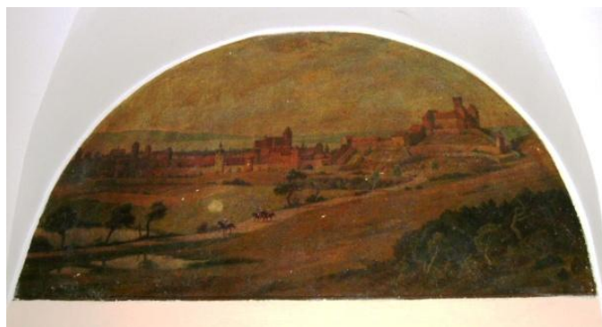
Rys. 14. Wyjazd Krzyżaków z zamku. Wilhelm Burza 13 .

Również na początku XX w. w wizji artystycznej brano pod uwagę bezkolejny wjazd do zamku od strony północnej, (ryc. 14).