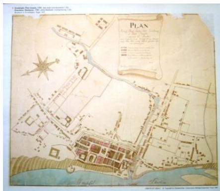
Ryc. 9 „Kopia W. Giesego planu z 1781 r.”

(ryc. 9). Jest to faktycznie plan rekonstrukcyjny z 1910 r., będący stylizowaną kompilacją kilku planów 4 .