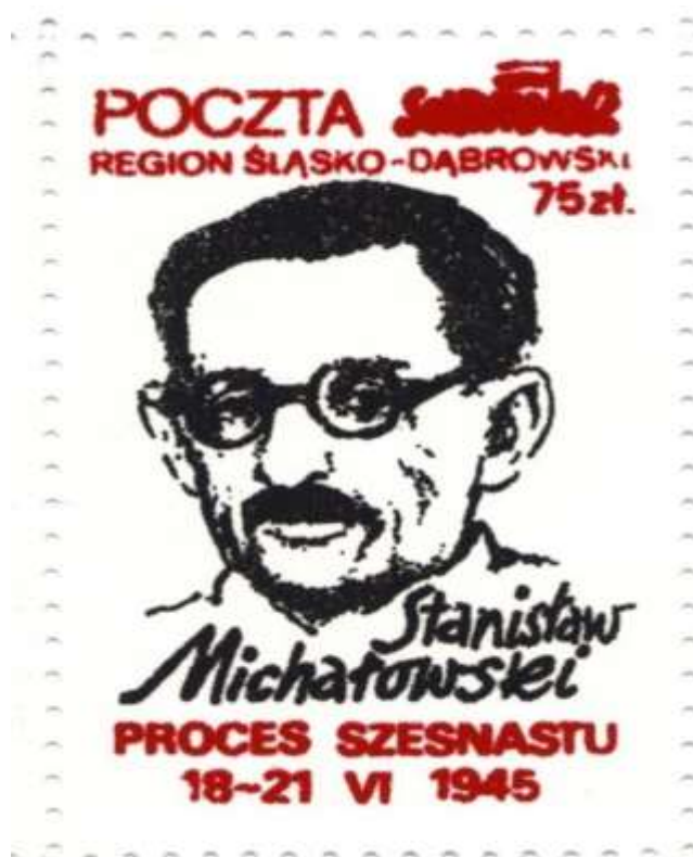
Podziemny znaczek pocztowy upamiętniający St. Michałowskiego z okresu stanu wojennego.