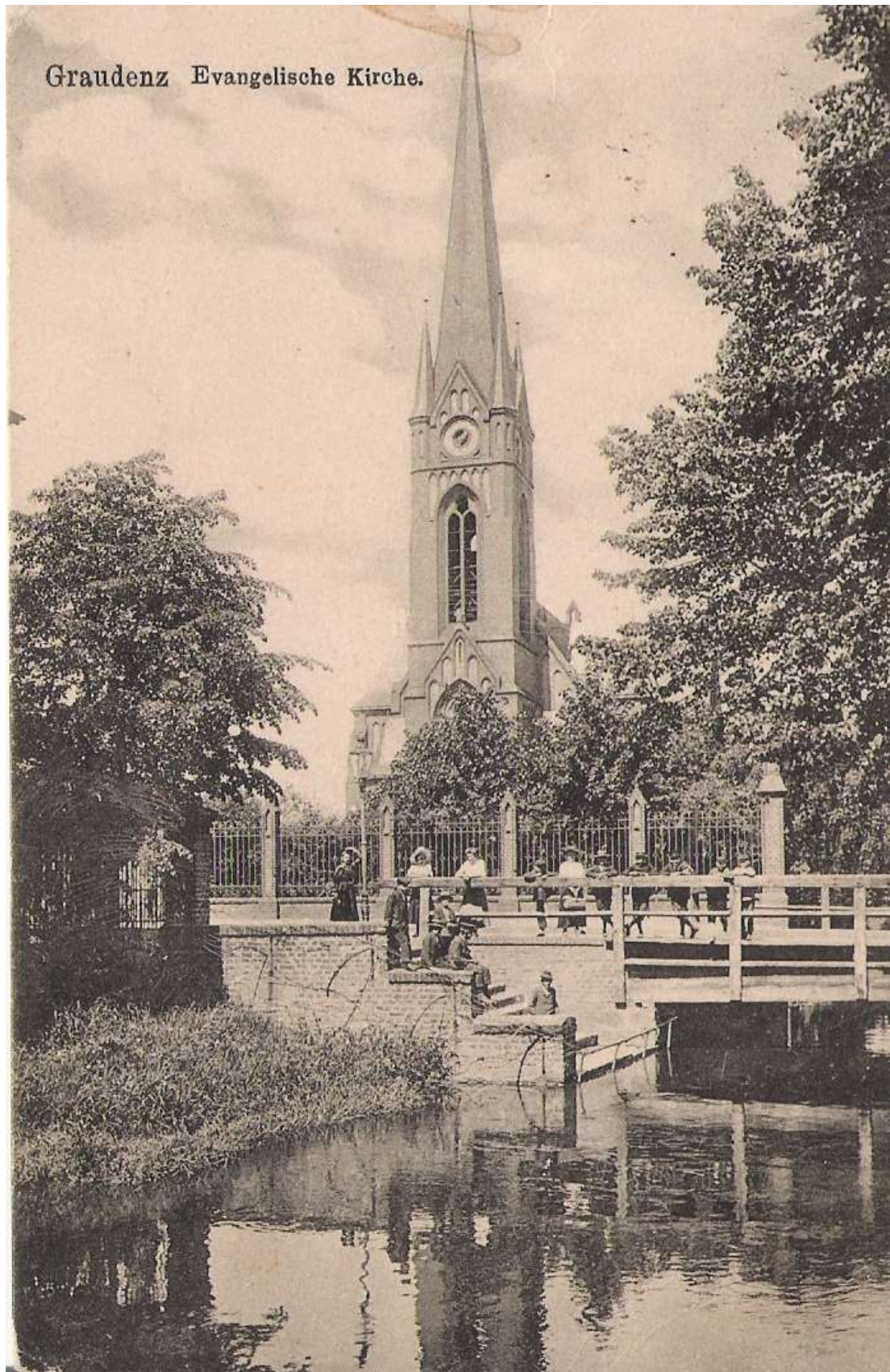
Kościół ewangelicki w Grudziądzu. Pocztcówka.