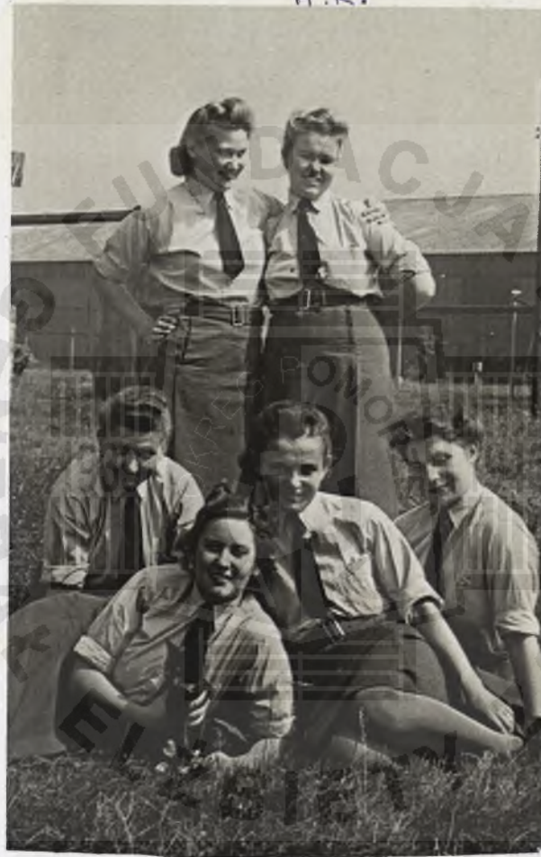
Obóz szkoleni R.A.F. Wilmslow, Anglia 1945