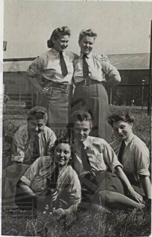
Obóz rekrutki R.A.F. Wilmslow, Anglia 1945