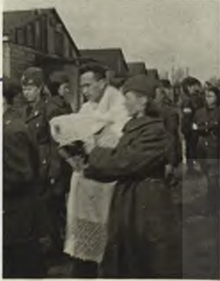
obserwacje po uwolnieniu obozu w Wielki Czwartek 1945