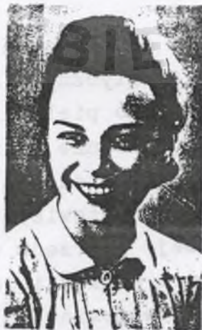
Zdjęcie wykonane tuż przed wybuchem Powstania Warszawskiego.