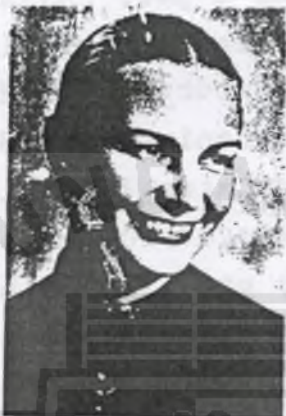
Zdjęcie wykonane w 1966r.

Mieszkając w Gliwicach często wyjeżdżała w góry w których się zakochała i w których spędzała wiele dni na wędrowniach po Tatrach i Beskidach