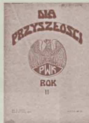
Strona tytułowa „Dla Przyszłości” R: 11, 1939 nr 2, czasopisma Organizacji Przystosowania Wojskowego Kobiet

w Toruniu (Dom Eskenów, ul. Łazienna 16) wystawa poświęcona tej służbie, zorganizowana przy współudziale Muzeum Okręgowego w Toruniu, Muzeum Tradycji Pomorskiego Okręgu Wojskowego w Bydgoszczy i Archiwum Akt Nowych w Warszawie, jako impreza towarzysząca XII sesji popularnonaukowej Fundacji nt. Służby Polek na frontach II wojny światowej. Zachętą do odwiedzenia tej wystawy przez młodzież szkolną ma być fakt iż będzie