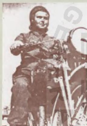
Motocyklistka z 316 Kompanii Transportowej Polskich Sił Zbrojnych na Zachodzie

prezentujemy. Będą mogli też zaprezentować własne zbiory, o ile oczywiście odpowiednio wcześniej wypożyczą lub prześlą w darze powstającemu Muzeum. I o to też apelujemy!