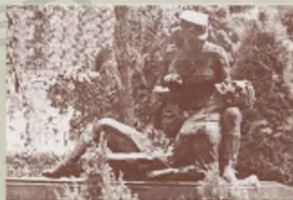
Pomnik sanitariuszki Ludowego Wojska Polskiego w Kołobrzegu

Do planowanej wystawy przygotowujemy katalog, który będzie też dostępny na naszej witrynie internetowej ( www.um.torun.pl/AK ), na której nie tylko młodzi – czytający dziś głównie te witryny – będą mogli odnaleźć wiele informacji o działalności Muzeum i Fundacji.