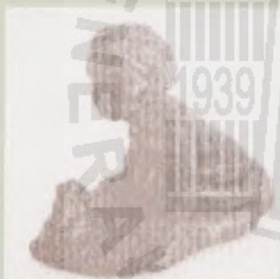
Figurka z chleba wykonana w l. 1942–1943 w więzieniu na Łukiszkach w Wilnie przez Janinę i Władysławę Rusickie