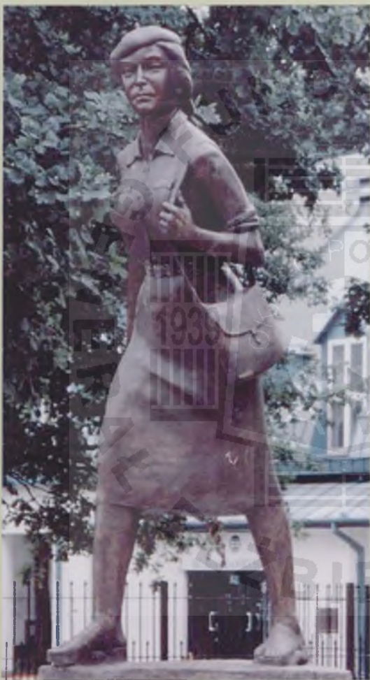
Pomnik Łączniczki Armii Krajowej w Józefowie, projekt prof. Bohdan Chmielewski (gipsowy odlew pomnika w Muzeum Wojskowej Służby Polek w Toruniu)

Stała ekspozycja zbiorów Muzeum czynna od 16 listopada 2002 r. w Domu Eskenów, przy ul. Łaziennej 16 w Toruniu