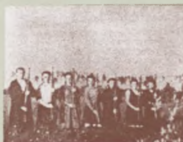
Szkolenie wojskowe sanitariuszek „Zielonego Krzyża” Batalionów Chłopskich

Już teraz zapraszamy na tę wystawę, zwłaszcza że w zamierzeniach jej organizatorów jest, aby miała ona objazdowy charakter. Będzie więc można ją obejrzeć we wszystkich większych miastach Polski. Zwiedzający będą mogli na niej zobaczyć, m.in. eksponaty, których fotografie tu