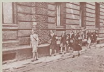
Patrol sanitarny Wojskowej Służby Kobiet Armii Krajowej w Powstaniu Warszawskim.