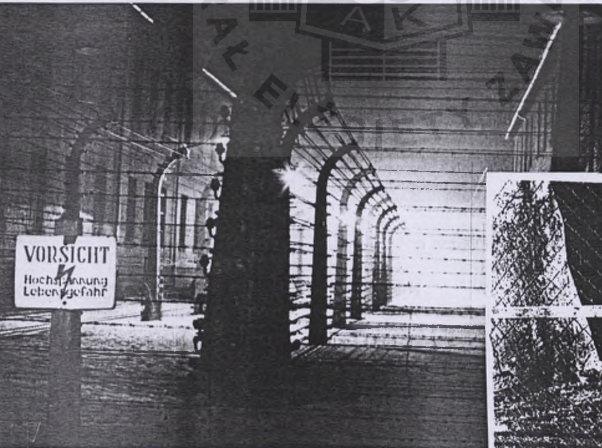
Auschwitz I. Ogrodzenie obozowe z drutu kolczastego było pod napięciem elektrycznym. Gestapo aus Stacheldraht stand unter Storm.