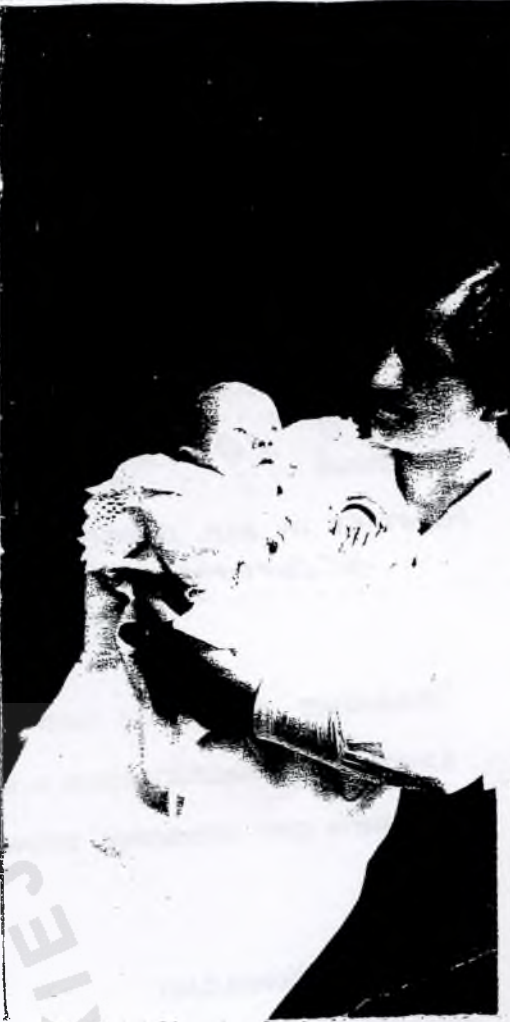
Rok 1915. Franciszek i F...