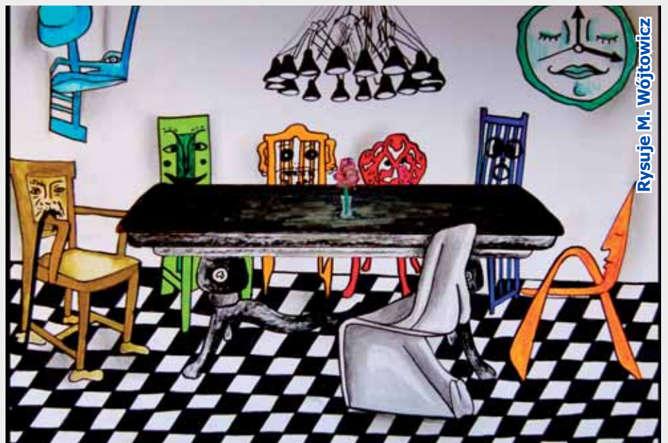
Rysuje M. Wójtowicz