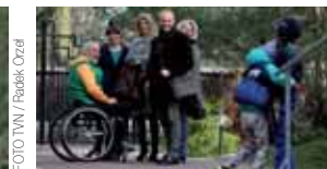
ITVN: serial „Sama słodczy” 26 maja, godz. 21.35

07:30 Podróżnik 07:55 Matka 24h film reż.: Marcin Janos Krawczyk 09:00 Nicolas Le Floch Tajemnica ulicy Zakonników 10:00 Dzika Polska U klumpy na imieninach 10:35 Makłowicz w podróży 11:15 Legenda 27 Wołyńskiej Dywizji Pechoty AK film reż.: Maria Wiśnicka Andrzej Wyrozębski 12:05 Sny stracone sny odzyskane film reż.: Arkadiusz Gołębiowski 12:40 Cafe Historia 13:00 Królowa chmur reż.: Radosław Piwoński 14:25 Mama film 15:00 Było nie minęło kronika zwiadowców historii 15:35 Ex Libris 15:50-16:25 Sensacje XX wieku 17:00 Nicolas Le Floch Tajemnica ulicy Zakonników 18:05 Kalendarium historyczne W pogardzie i chwale Wojciech Korfały 19:00 Dziennik telewizyjny 19:45 Kolo historii: Zamach na Pierackiego 20:20 Spór o historię Francuska kolaboracja 21:00 Flesz historii 21:25 Było nie minęło kronika zwiadowców historii 22:00-22:35 Sensacje XX wieku 23:00 Legenda 27 Wołyńskiej Dywizji Pechoty 00:10 Dzieci Zamajsczyzny film 01:00 Niemcy film reż.: Dariusz Król 01:40 Serce matki 03:10 Zakończenie dnia