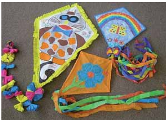
Latawce wykonane przez dzieci na warsztatach plastycznych DALI w Gliwicach

Istnieje wiele rodzajów latawców. Najprostsze z nich, typu delta (w kształcie trójkąta) szybują nawet przy słabym wietrze.