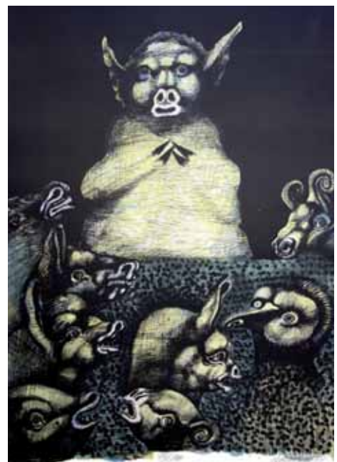
Ilustracja do Folwarku zwierzęcego George'a Orwella z 1974 r. (litografia)