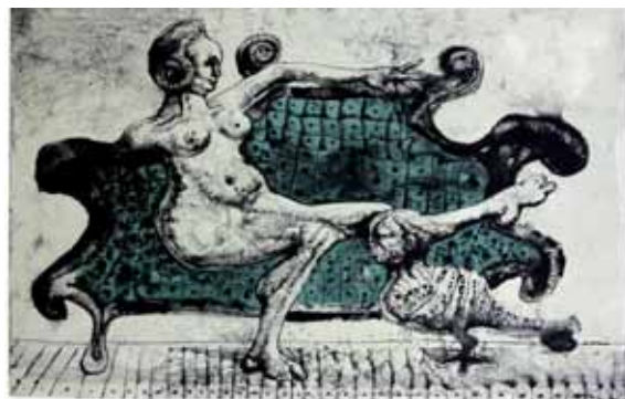
Pani domu , litografia z 1966 r.