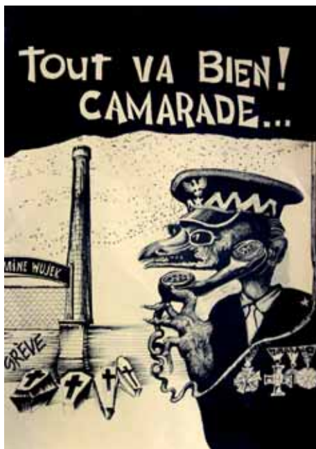
Plakat polityczny z 1982 r. przeciwko stanowi wojennemu

O codzienności Lebensteina opowiadał Gustaw Herling-Grudziński. Przyjaciel artysty, po kończących się