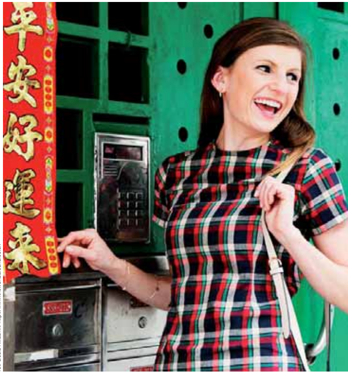
fol. Gosia Kwasiak: http://www.theworldaround.co.uk