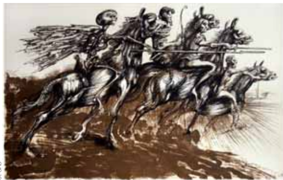
Ilustracja do Apokalipsy z 1985 r. (litografia)