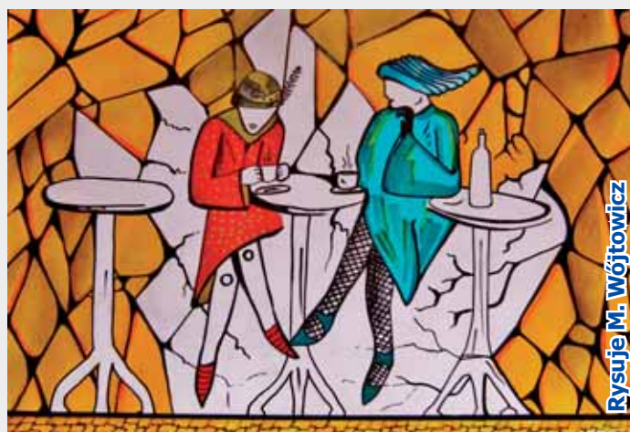
Rysuje M. Wójtowicz