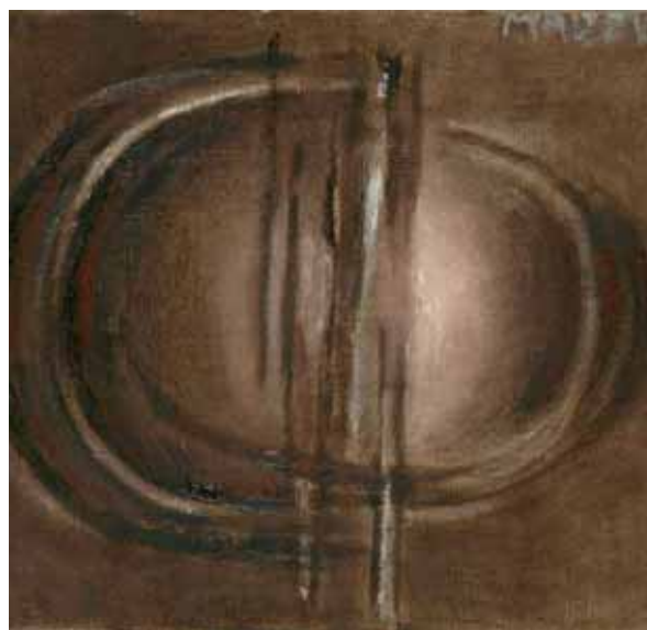
Kompozycje owalne artystki spowite w brązy

Na tle abstrakcji niezwykle odmienne jest jej malarstwo przedstawieniowe. Na pierwszy rzut oka nieco prymitywne, zwykle kolorowe domki, pejzaże.