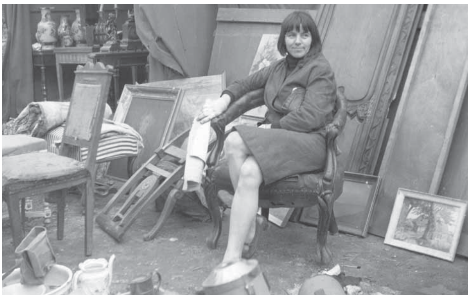
Artystka na jednym z „pchlich targów” w Paryżu

Ciekawa świata podróżniczka, o niezwyklej wrażliwości i delikatności, zdominowana onieśmieleniem. Wystawiała nieustannie na całym nieomal świecie (Polska, Stany Zjednoczone, Brazylia). Mimo to jej twórczość osnuta została mgłą zapomnienia. „W dalszym ciągu nie