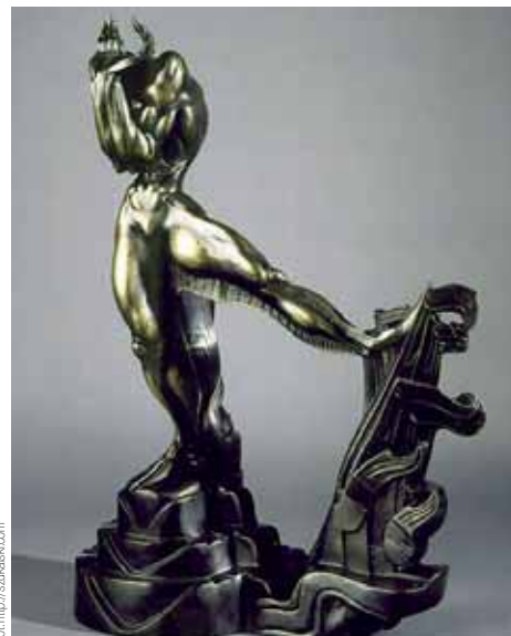
Stanisław Szukalski, Echo , rzeźba