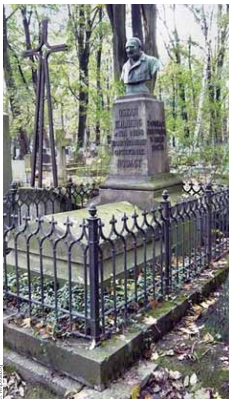
Grób Oskara Kolberga na cmentarzu Rakowickim w Krakowie

badaczem, który uporządkował według regionów wiedzę na temat polskiej twórczości ludowej - muzyki, tańców, zwyczajów i mowy. Napisał również ok. 200 artykułów z zakresu etnografii, folklorystyki, językoznawstwa i muzykologii. W swoich zapiskach utrwalił ok. 10 tysięcy melodii ludo-