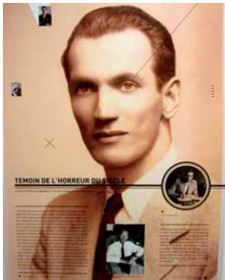
Część wystawy w paryskiej siedzibie UNESCO

w czerwcu wpadł w ręce gestapo, ale na szczęście wkrótce został odcygnięty. Był działaczem Biura Propagandy i Informacji Komendy Głównej AK, oraz Frontu Odrodzenia Polski.