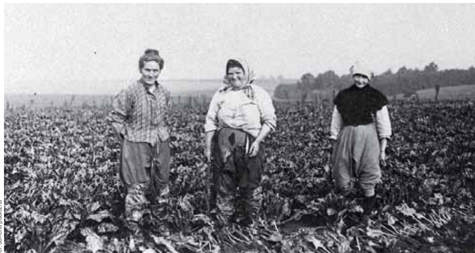
fol. domena publiczna