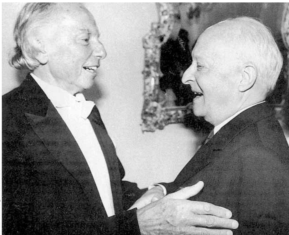
Andrzej Panufnik i Witold Lutosławski

W swojej twórczości stale powracał do tematów związanych z Ojczyzną. W 1990 r., po 36 latach nieobecności w kraju, odwiedził Polskę na zaproszenie festiwalu Warszawa Jesień, podczas którego wykonano jedenaście jego utworów. Wtedy też otrzymał nagrodę polskiego MSZ za zastugi dla kultury polskiej. Rok później królowa Elżbieta II przyznała mu tytuł szlachecki. Sir Andrzej Panufnik zmarł w 1991 roku w swoim domu w Twickenham.