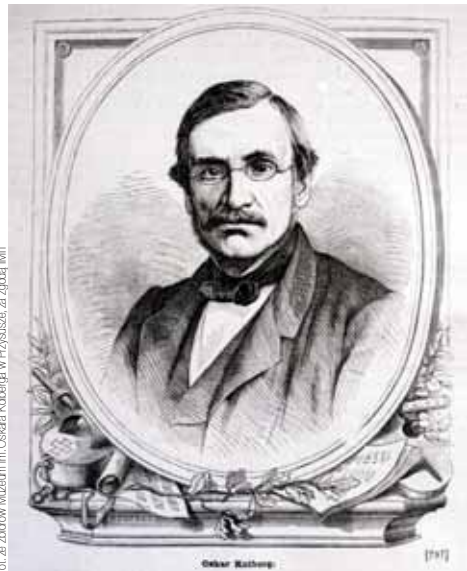
Drzeworyt, A. Regulski, wg rys. F. Tegazzo

W listopadzie, wyskakując z jadącego pociągu, przedostał się pieszo do Warszawy, gdzie rozpoczął działalność konspiracyjną. Od początku roku 1940 brał udział w misjach kurierskich do rządu polskiego na uchodźstwie we Francji. Niestety,