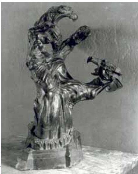
Stanisław Szukalski, Struggle , rzeźba