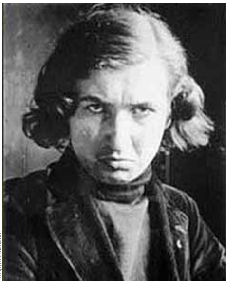
Stanisław Szukalski, portret