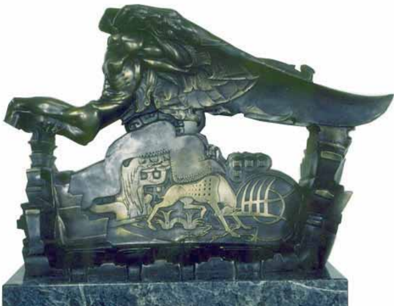
Stanisław Szukalski, Frozen Youth , rzeźba

*Cytaty [za:] L. Lameński, Stach z Warty Szukalski , Lublin 2007.