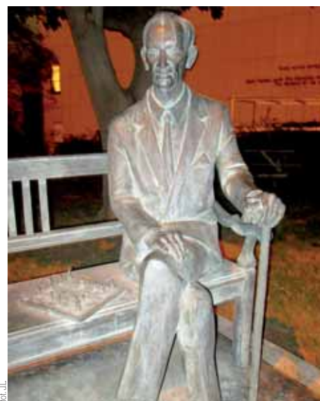
Pomnik Jana Karskiego w Tel-Awiewie

Kolberg jest mało znany w świecie, bo swoją pracę dokumentował w języku polskim. Specjalny program Kolberg 2014 – Promesa , ogłoszony przez Bogdana Zdrojewskiego, Ministra Kultury i Dziedzictwa Narodowego, ma pozwolić na zapoznanie się z postacią Oskara Kolberga, poprzez dużą ilość przedsięwzięć artystycznych i naukowych. Ma to być również okazją do promocji polskiej kultury ludowej.