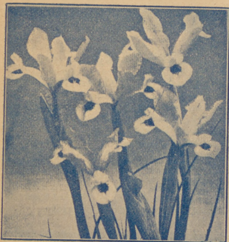
Irysy — Kosańce