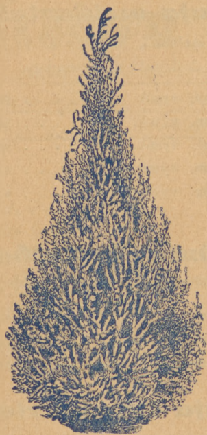
Chamaecyparis Laysonina Alumi.