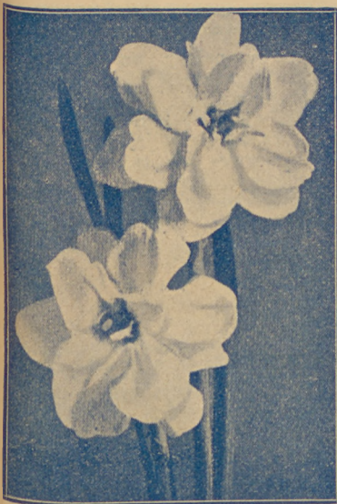
Narcyzy pełne Albo pleno odorato.

Barri Conspicuis, jasno-żółty, o półdługim pomarańczowym kielichu, doskonały do wypędu