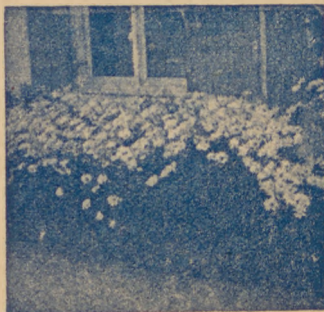
Achillea ptarmica fl. pl.