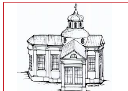
Moskwa, kościół jezuitów pw. Świętej Trójcy (1708), spalony w 1812 roku