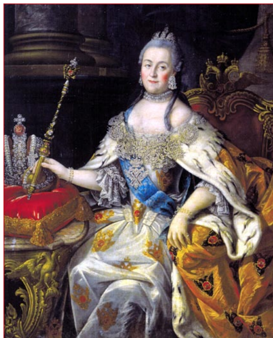
Katarzyna II Wielka (1729-1796) – ustaliła normy prawne dla obcych wyznań w cesarstwie