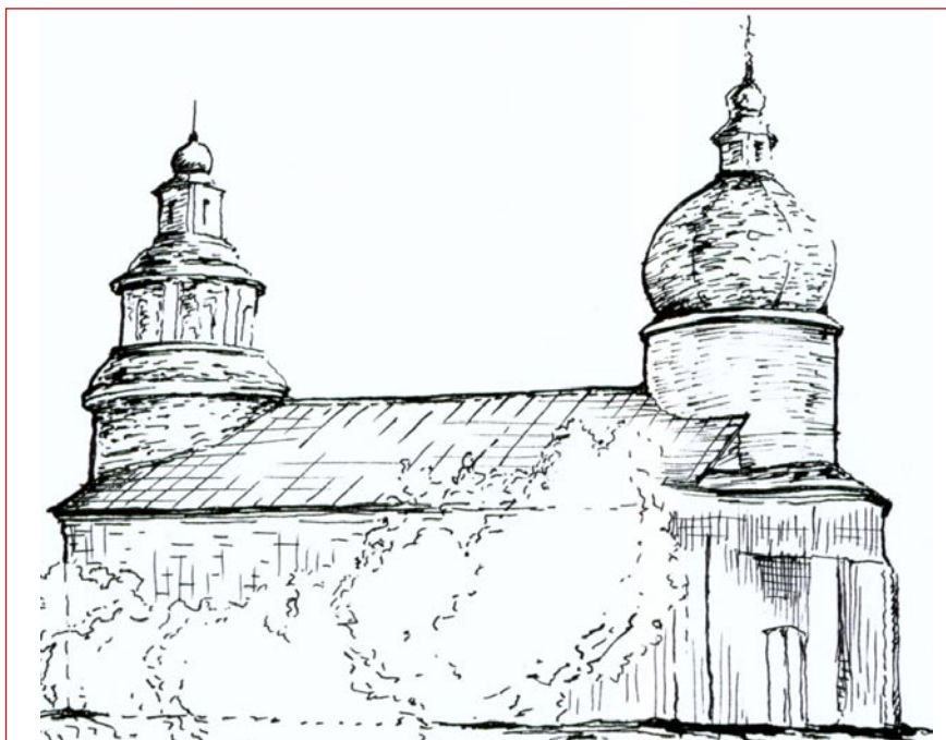
Gross Werder, kościół pw. Matki Boskiej Różańcowej z końca XVIII w. i po późniejszych przebudowach