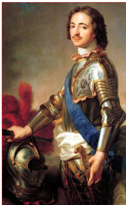
Piotr I Wielki (1672-1725) – pierwszy władca tolerujący katolicyzm w Rosji