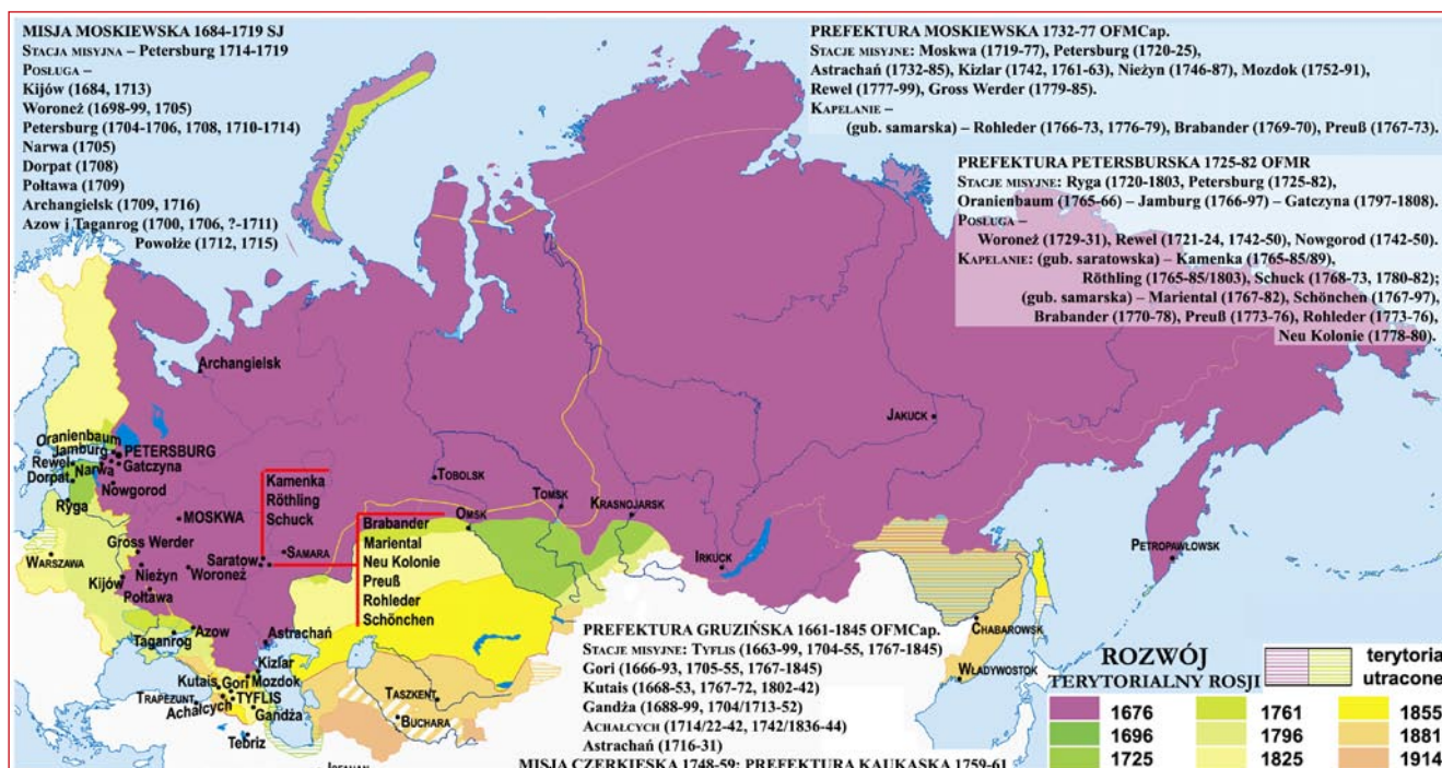
Kościół katolicki w cesarstwie rosyjskim – okres misyjny 1684-1845

ze skarbu, nie ograniczając specjalnie kontaktów z Kongregacją Wiary.