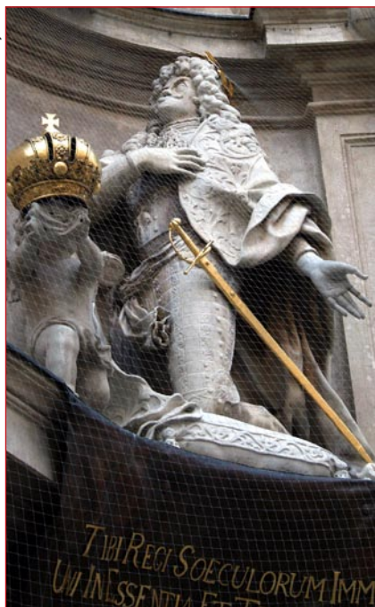
Leopold I Habsburg (1640-1705) – fundator misji moskiewskiej 1684-1719