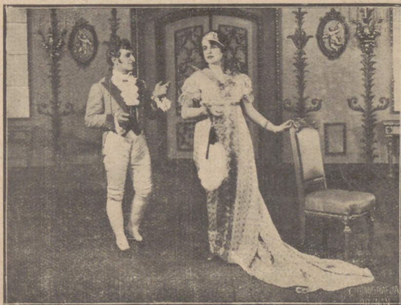
St. Moniuszki: „Hrabina“