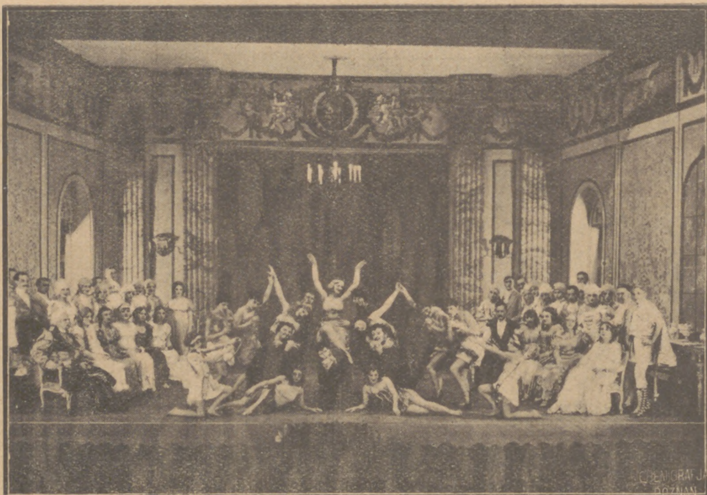
Festiwal moniuszkowski w Teatrze Wielkim; „Hrabina“ w inscenizacji K. Urbano vicza

int-Saensa „Samson i Dalila“ — jako jedenasta premjera w tym sezonie, od września. Z tym dorobkiem pójdziemy na czerwcowy wypoczynek, należny naszemu zespołowi i konieczny po 22-miesięcznej pracy bez ferji, uniemożliwionych zeszłoroczną „Pewuką“. W lipcu natomiast wracamy na swe postępowki, ze względu na „Międzynarodową Wystawę Komunikacyjną“;