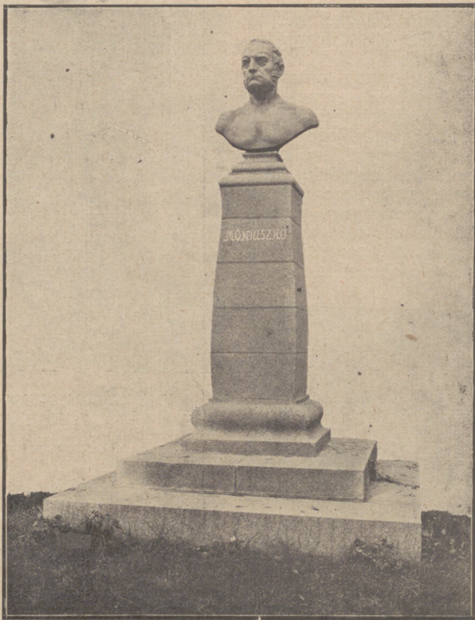
Pomnik St. Moniuszki w parku jego imienia w Poznaniu

tat i dzieł chóralnych wykonane były: Milda (w Lesznie, Swarzędzu, Głównej, Opalenicy), „ Litanja Ostrobramska “ (w Inowrocławiu, Opalenicy, Swarzędzu), „ Widma “