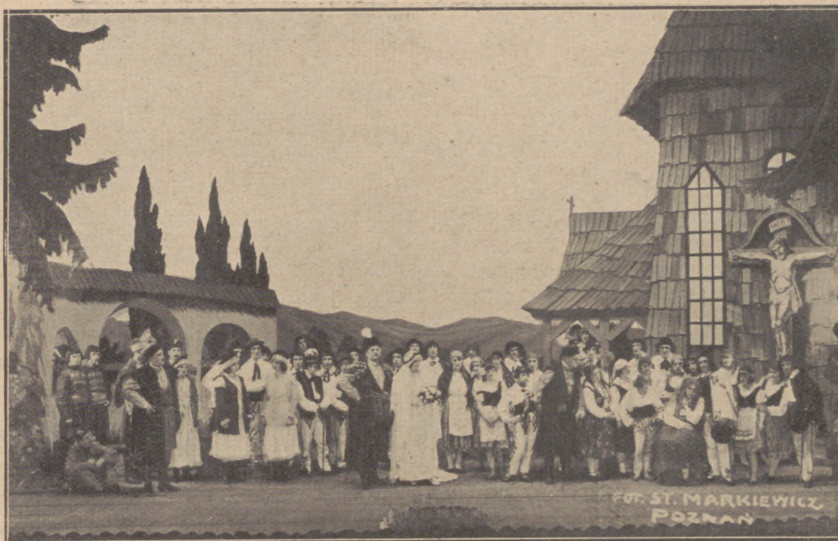
Festiwal moniuszkowski w Teatrze Wielkim: „Halka“ w inscenizacji K. Urbanowicza

— Naturalnie, że jest to moja naczelną troską, by wpływać na muzyczne wychowanie, umuzykalnienie młodzieży i w ten sposób, jedyny zresztą, wychować sobie przyszłych słuchaczy i wielbicieli muzyki. Kto dzisiaj z powojennego pokolenia uprawia kult muzyki, gdzie prywatne zespoły, gdzie domowe wieczorki amatorów? Płyta gramofonowa, głośnik — a