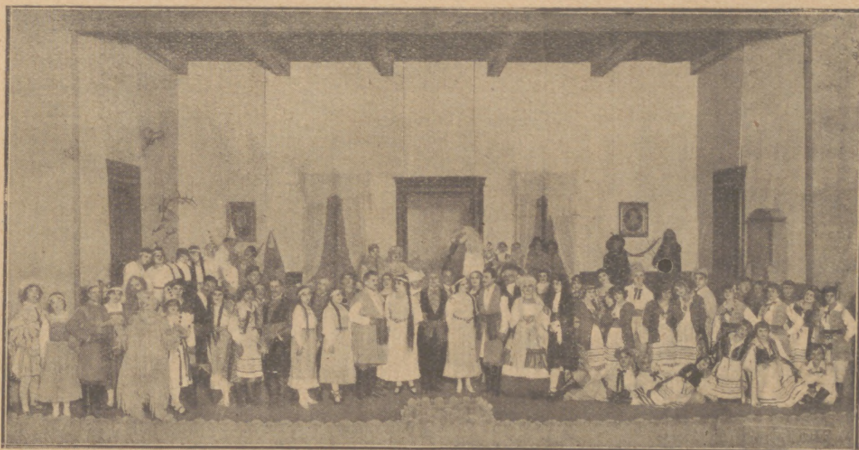
Festiwal moniuszkowski w Teatrze Wielkim: „Straszny Dwór“ w inscenizacji K. Urbanowicza

Dysproporcjonalnie długą uweriturą, przedstawiającą burzę na Wiśle, zaczął Moniuszko „Flisa“. W utworze tym łączy się bardzo harmonijnie pierwiastek muzyki ludowej z tendencją programową. Kompozycja technicznie świeżością pomysłów i odznacza się barwnością instrumentacji. Kilka numerów partytury ma ładne melodie i bardzo misterne wykończenie.