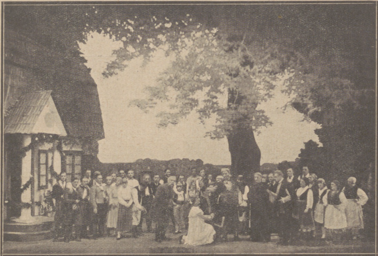
Festiwal moniuszkowski w Teatrze Wielkim: „Verbum Nobile“ w inscenizacji K. Urbanowicza

Duet między Zosią a Frankiem nie odznacza się większymi zaletaniami inwencji melodyjnej, ani wyrazu. Do końca opery nie znajdziemy już w partyturze ustępów, któreby poza płynnością frazy i symetrią budowy odznaczały się