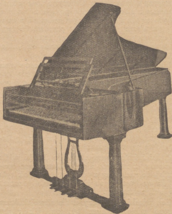
Fortepian, na którym uczył się Moniuszko