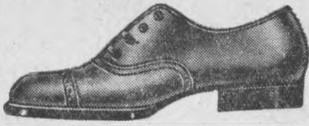
Fason 3632-22 Bronzowe półbutki z boksu, gustownie ozdobione. Skórzana podeszwa, gumowy obcas.