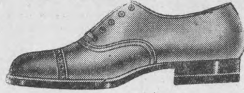
Fason 1634-22 Eleganckie i wygodne półbutki z brązowego boksu cielecego, na mocnej skórzanej podeszwie.