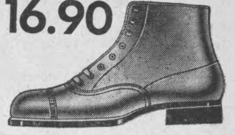
Fason 3672-22 Dla chłopców do szkoły te sznurowane butki z czarnego boksu cielecego. Mocna podeszwa, gumowy obcas.

Niniejszem zawiadamiam pp. Kupców, Przemysłowców i Urzędy, że