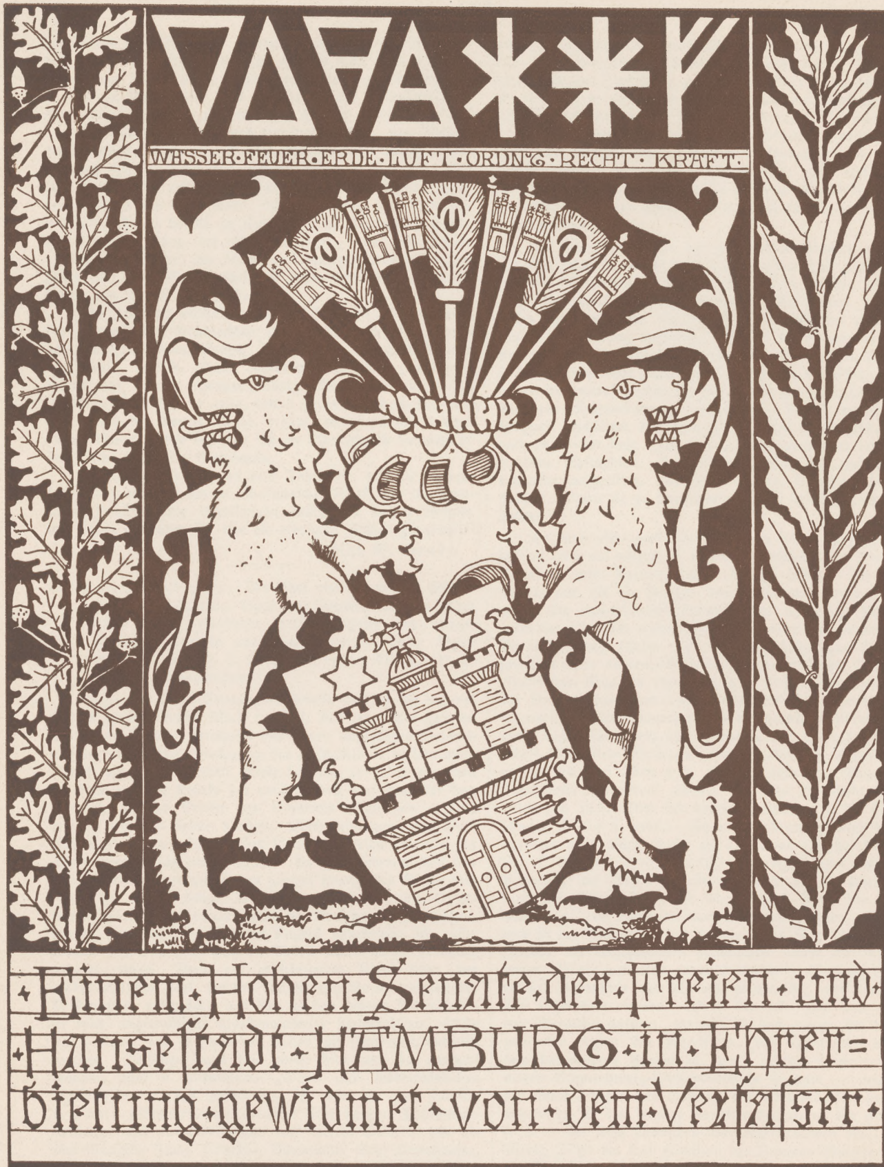
Widmungsblatt aus der Hamburger Wappenrolle von Ed. L. Lorenz-Meyer