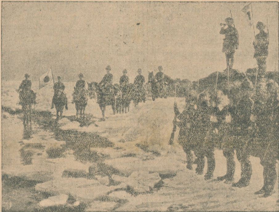
Na dalekim Wschodzie...

Wykłady na Uniwersytecie zostały zawieszono na czas nieograniczony.