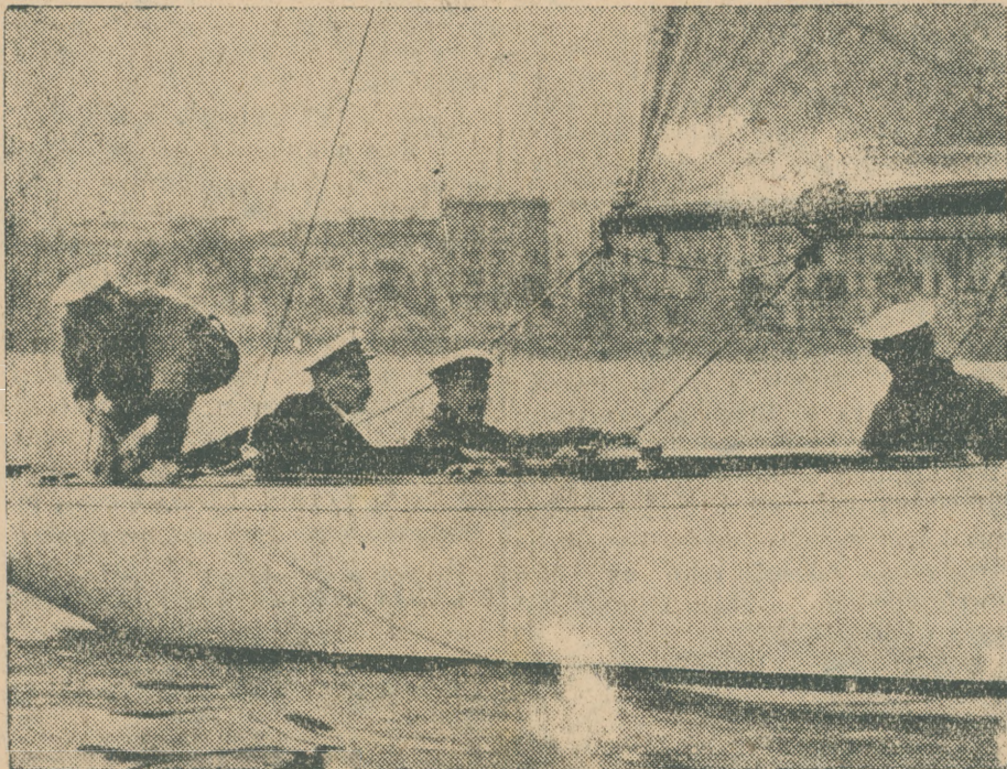
Król duński na regatach w Cannes Król (drugi od lewej) na swym jachcie „Dania” podczas wyścigów