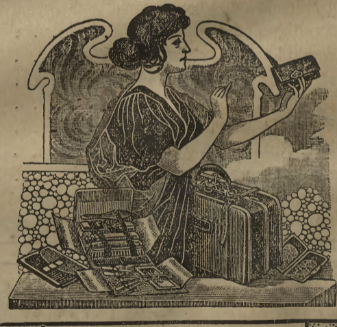
Lieferant des Lehrer-Wirtschafts-Verbandes.

Hand- und Reisetaschen, Schultaschen, Musiktaschen, Brieftaschen, Cigarrentaschen, Portemonnaies, Herren- u. Damen-Koffer, Rohrplatten-Koffer, Plaidriemen, Pierdelecken, Schaukelpferden.