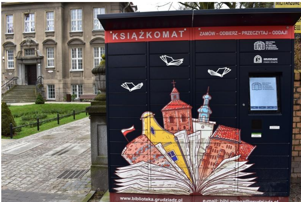
Książkomat przed wejściem głównym do gmachu biblioteki