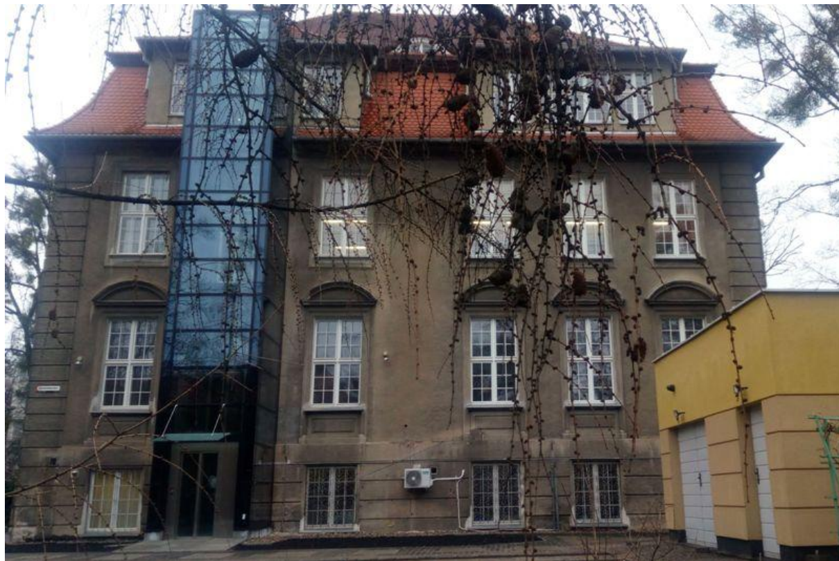
Wybudowana nowoczesna winda (od strony ogrodu bibliotecznego)

Następny rozdział charakteryzuje działalność kulturalno-oświatową biblioteki ostatnich lat. Oferta składa się z różnorodnych działań takich jak organizacja: spotkań autorskich z pisarzami, podróżnikami, hobbystami, zajęć edukacyjnych dla dzieci, warsztatów dla wszystkich grup wiekowych, wystaw i ekspozycji, lekcji bibliotecznych, spektakli teatralnych, pogadanek czy akcji bookcrossingowych. Biblioteka włącza się w organizację wydarzeń o zasięgu ogólnopolskim, jak i lokalnym. Szczególną uwagę w aktywizacji kulturowej instytucja kieruje wobec dzieci, młodzieży i seniorów. Wszystkie działania mają na celu promocję czytelnictwa, książki i biblioteki. Księżnica grudziądzka współpracuje z miejskimi instytucjami, stowarzyszeniami, organizacjami społecznymi i edukacyjnymi.