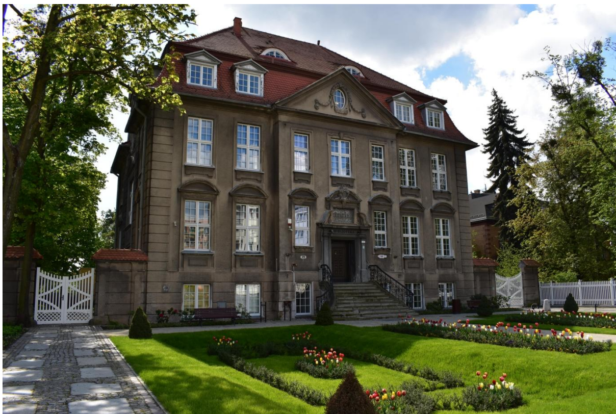
Gmach główny Biblioteki Miejskiej im. W. Kulerskiego w Grudziądzu

wydawnictwo uzupełnia historię grudziądzkich bibliotek o okres powojenny i współczesność.