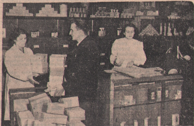
Aby uczcić II Zjazd PZPR pracownicy handlu uspołecznionego podejmują liczne zobowiązania, mające na celu usprawnienie obsługi i lepsze zaspokojenie potrzeb konsumentów.

Załoga Centralnego Domu Dziecka w Warszawie podjęła szereg zobowiązań przedzjazdowych. M. in. magazynierzy postanowili dostarczać towary z magazynów do działów i stoisk natychmiast po otrzymaniu wiadomości, że towarów tych zabrakło.