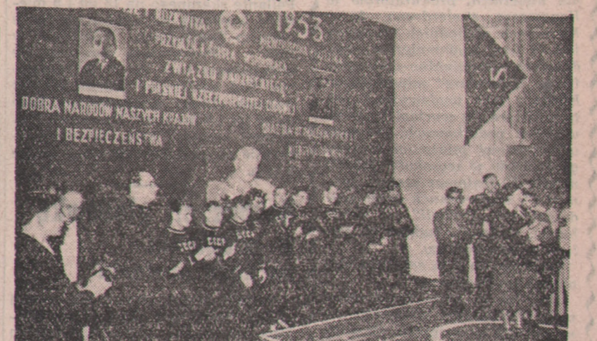
Przodujący w świecie sztangiści radzieccy w czasie swego dwudniowego pobytu w Bydgoszczy wystąpili m. in. wśród załogi PZWME, którą zgotowała im serdeczne przyjęcie.