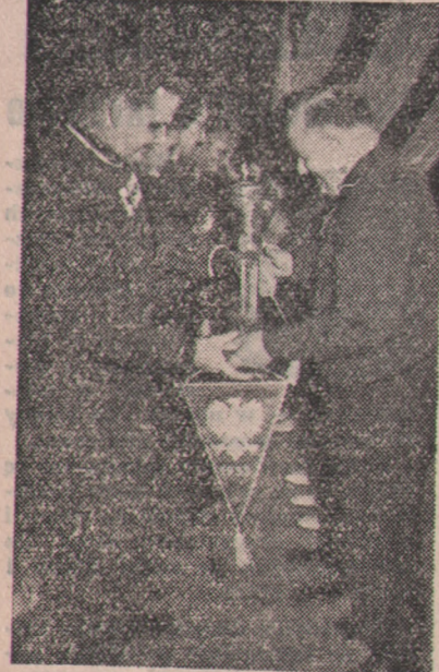
Serdeczne uściski dłoni, wymiana upominków — tak rozpoczęło się warszawskie spotkanie sztangistów radzieckich i polskich. Planem tego przyjacielskiego spotkania były rekordy świata, ZSRR i Polski.

Pierwsze spotkanie obu drużyn rozegrane na 10 szachownicach przyniosło zdecydowaną przewagę szachistom radzieckim, którzy wygrali 6 partii, jedna partia zakończyła się remisem a 3 pozostały obojętne. Po drugiej rundzie spotkania na 10 szachownicach i dogrywkach ekipa szachistów radzieckich rozdzieliła się na dwie grupy i rozegra spotkanie w miastach Linz i Graz.