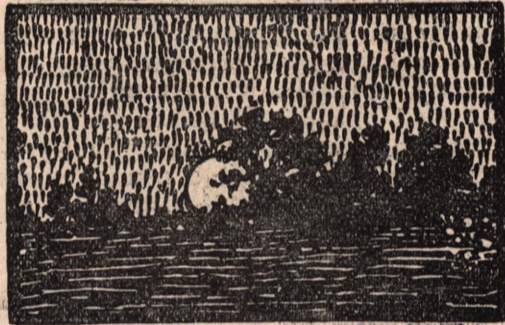
n o c