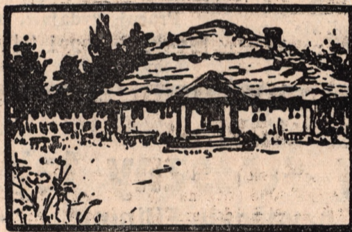
d o m