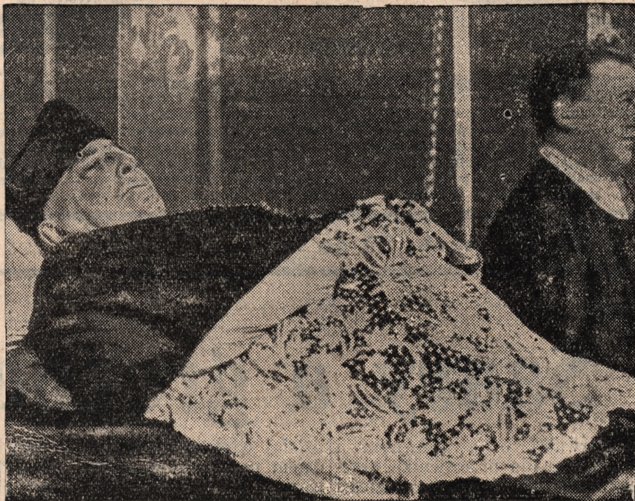
Sp. Kardynał Gasparri na łożu śmierci

wała Polska, odmawiając przystąpienia do paktu wschodniego: a więc Polska nie chciała przyjąć gwarancji odnośnie granicy polsko-litewskiej i granicy polsko-czeskiej.