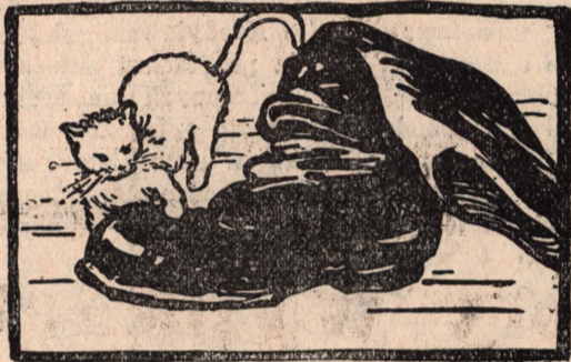
b u t