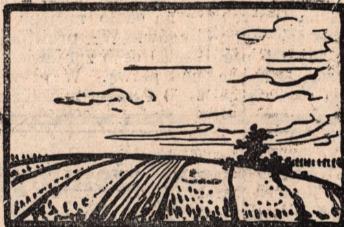
p o l e