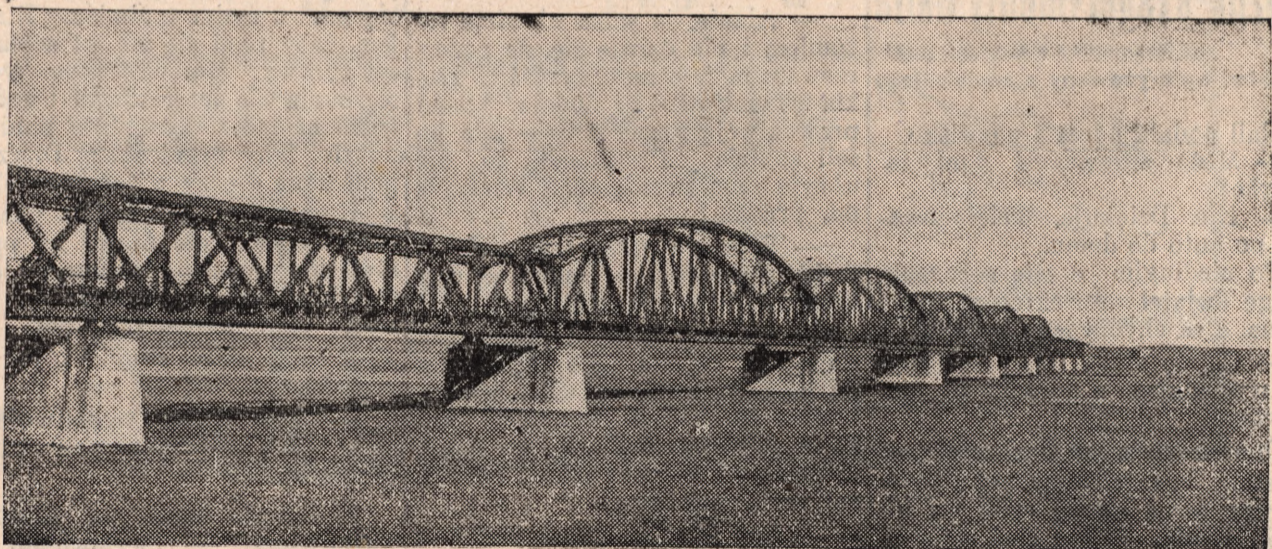
Most żelazny przez Wisłę w Opaleniu, pow. tczewskiego, który przeniesiony został do Torunia. Widok ze strony polskiej.

misji Granicznej — ani na obchód nie zaproszono, ani — nie wspomniano. A było naprawdę za co zdobywcy tego mostu — nawet podziękować!