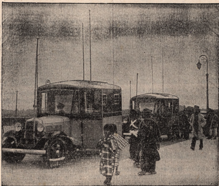
Nowe auta policji w Tokio, które specjalnie przeznaczone są do ścigania przestępców, zostały zaopatrzone w radiowe aparaty nadawcze i odbiorcze.

armji służą ludzie od lat 45 do 55. Daje ona blisko 2 miliony żołnierzy. Tak więc armja niemiecka liczy 6 milionów żołnierzy.