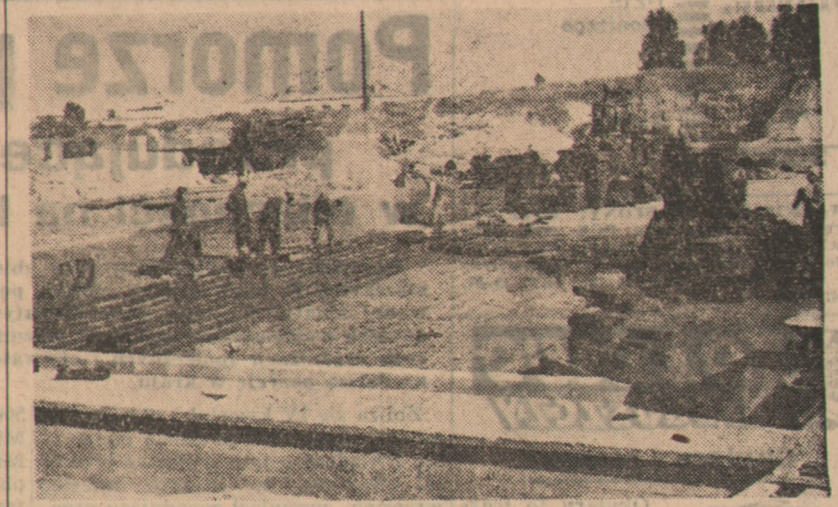
Przy ul. Łazienkowskiej w Warszawie powstaje sztuczne lodowisko o wymiarach 30x60 metrów. Będzie to drugie po stalinogrodzkim „Torkacie” sztuczne lodowisko w Polsce. Lodowisko ma być czynne jeszcze w bieżącym roku. Na zdjęciu: Ogólny widok płyty lodowiska w budowie.