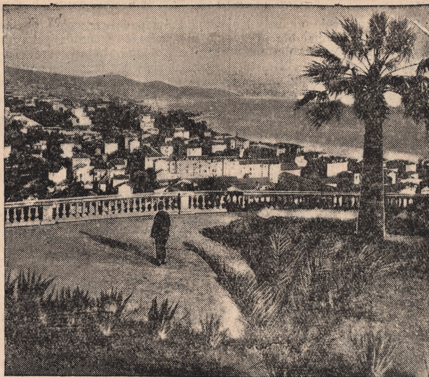
Widok San Remo, pięknie położonego kąpieliska na włoskiej Riwierze. Do tej miejscowości przeniesione mają być obrady sygnatariuszy paktu czterech w sprawach konferencji rozbrojeniowej.