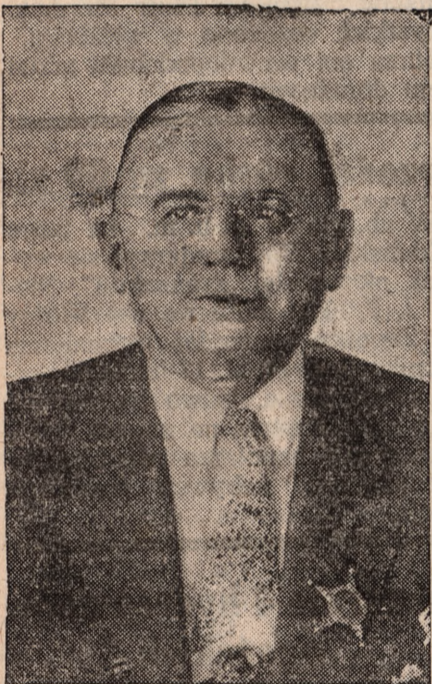
OFIARA ZAMACHU ZANGARY.

Centralne Towarzystwo Rolnicze było najstarszą instytucją tego rodzaju w kraju, powstała z funduszy, zebranych wśród większej własności rolnej.