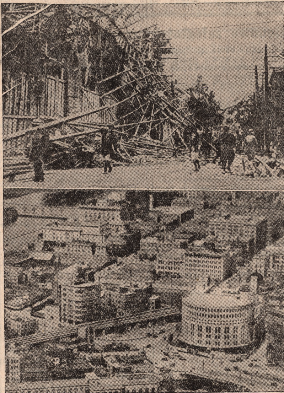
STRASZNE SKUTKI TRZĘSIENIA ZIEMI W JAPONII.