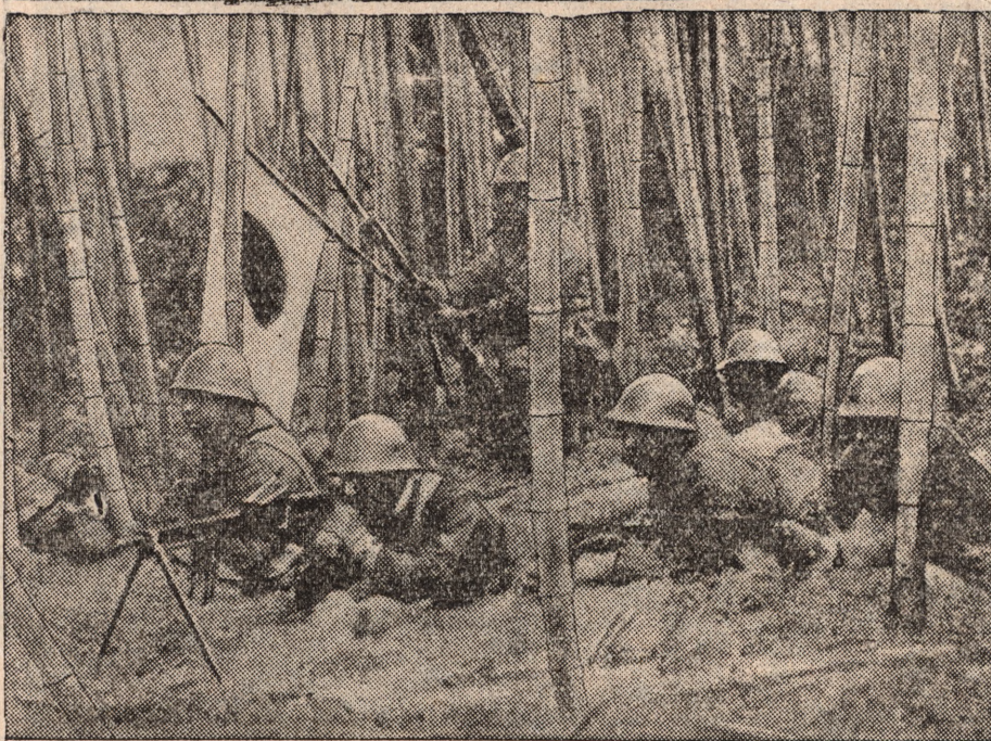
WŚRÓD LASÓW BAMBUSOWYCH.