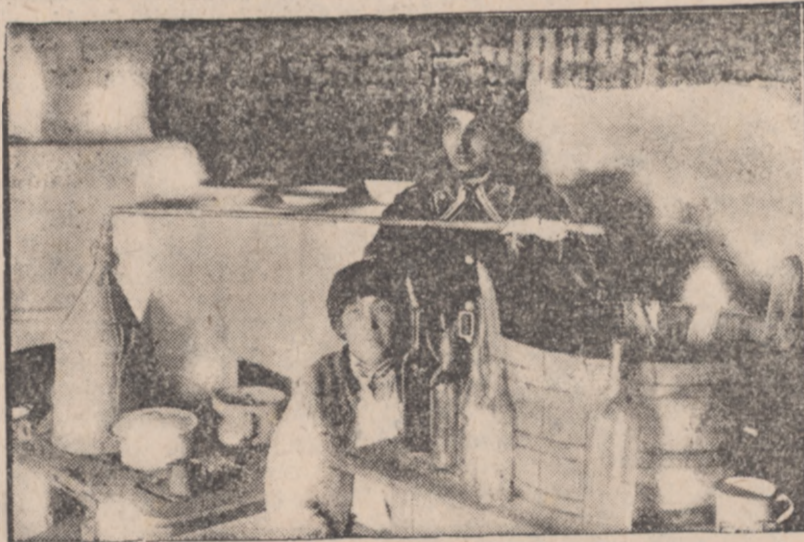
WYKRYCIE TAJNEJ GORZELNI.