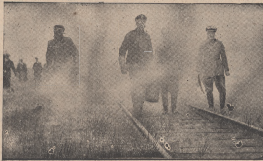
NIEMIECKIE PRZYGOTOWANIA DO WOJNY.

Słowem Związek Inwalidów Wojennych według zdania olbrzymiej większości delegatów stał się domeną na której żeruje zamknięte koło „swoich ludzi“.