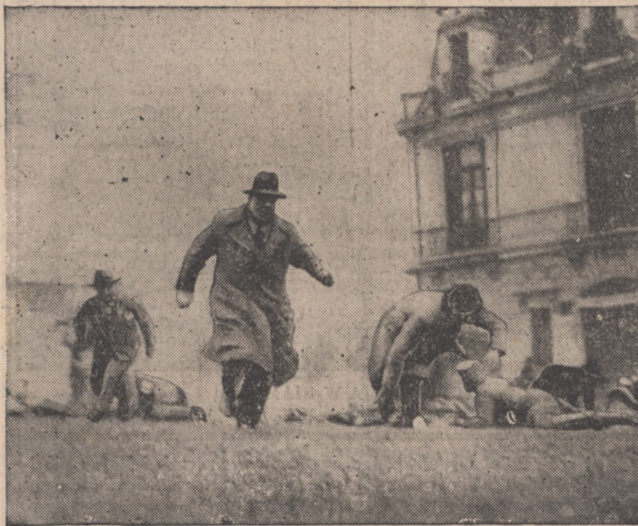
PIERSZE ORYGINALNE ZDJĘCIE Z REWOLUCJI W CHILE

Redakcja nasza rezolucyj takich otrzymała ponad 300 z najrozmaitszych okolic całej Polski.