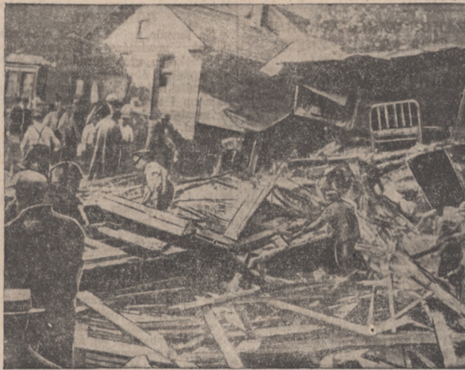
NIEZWYKŁA KATASTROFA SAMOCHODOWA

W dziennikach warszawskich pojawiły się charakterystyczne dla obecnych czasów ogłoszenia. Oferują się tam np. służące bezpłatne (!) do pracy i do gospodarstwa wiejskiego. — Nie mogąc, widać, znaleźć posad płatnych, ofiarują swe usługi bez poborów, byleby tylko za pracę mieć utrzymanie. Inne znów ogłoszenie donosi, że „inteligentka pragnie zostać pokojówką lub boną do dzieci“.