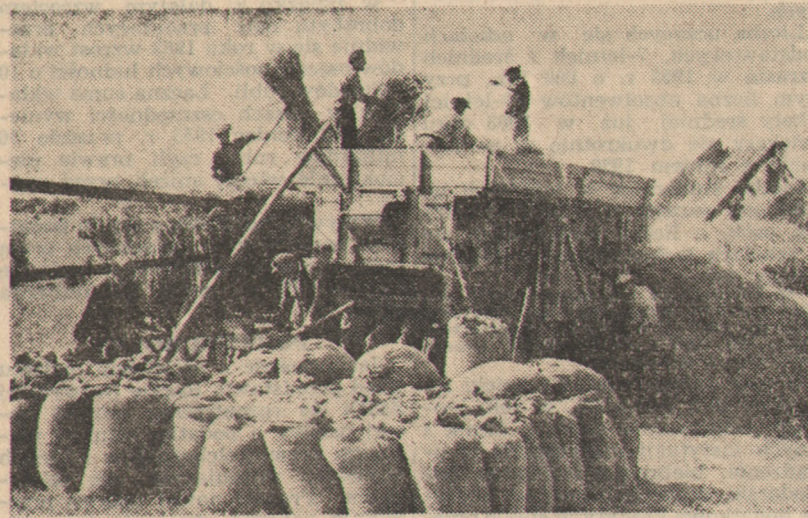
Omloty w PGR Mąkowarsko, pow. Bydgoszcz przebiegają sprawnie. Na zdjęciu: Brygada polowa przy pracy.

Mieszkańcy gromady Ostrowo nad Gopiem, zrzeszeni w rolniczej spółdzielni wytwórczej „Piast”, podejmując podobne zobowiązanie postanowili przedterminowo odstawić do punktu skupu 30 ton tegorocznych zbiorów na poczet planu rocznego.