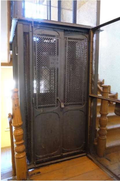
Dźwig osobowy w kamienicy przy ul. Legionów 31 w Grudziądzu. Kabina dźwigu zawieszona na jednej z kondygnacji, 2022.