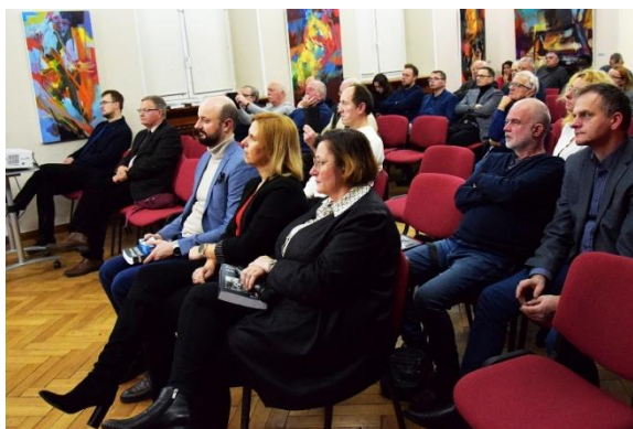
Promocja XXXI tomu Rocznika Grudziądzkiego w salach Muzeum im. ks. dr. Władysława Łęgi w Grudziądzu, 7.12.2023 r.

Różnorodność tekstów opublikowanych w XXXI tomie Rocznika Grudziądzkiego sprawia, że jest to wydawnictwo, które można polecić szerokiej grupie odbiorców. Cieszy fakt, że z jednej strony periodyk tworzy stała grupa autorów, a jednocześnie z każdym rokiem jego łamy otwierają się na nowych twórców. Poszerzają się również kręgi jego Czytelników.