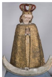
Rzeźba Matki Bożej Skepskiej a 1841 r. autorstwa M. Milkowskiego ze zbiorów Muzeum im. ks. dr. Wł. Łęgi w Grudziądzu.