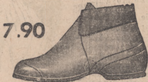
7.90 Fason 2861-01 Dziecięce całogumowe śniegowce, na trykotowej ciepłej podszewce, z aksamitnym kołnierzykiem.