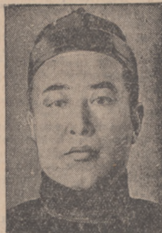
Cesarz Pu Ji.

Na byłego cesarza Chin, Pu Ji, który zamieszkuje w hotelu na terenie japońskiej koncesji w Tsien-Tsinie, usiłowano dokonać zamachu. Pewien Chińczyk przesłał cesarzowi dwa kosze owoców i dwie puszki blaszane z herbatą. Otoczenie cesarza znalazło w koszu i puszcę blaszaną bomby. Nadawcy przesyłki nie zdołano ująć.