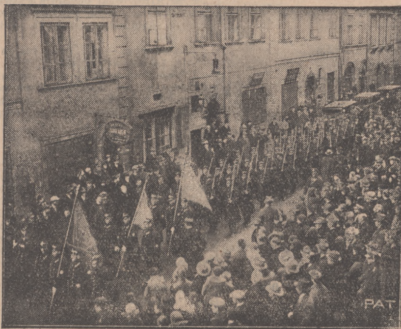
WAŻNY ZJAZD PRACOWNIKÓW W TELEFONÓW I TELEGRAFU W WARSZAWIE

Proszę Panów, przechodzę do Ministerstwa Oświaty — i tu trzeba powiedzieć, że to Ministerstwo odczuło najbardziej ciężar kryzysu. Zrobiono tu oszczędności na 29 milionów złotych. Wydatki na szkolnictwo powszechne,