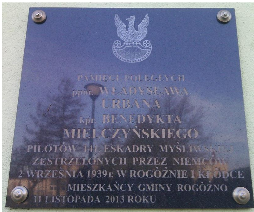
Pamiętkowa tablica ku czci pilotów na urzędzie gminy w Rogóźnie.