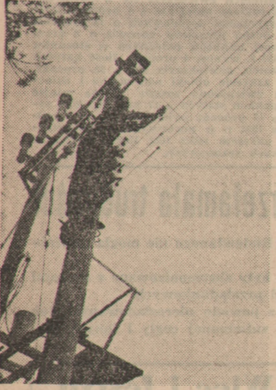
Na zdjęciu: Zakładanie sieci elektrycznej na terenie spółdzielni produkcyjnej Walewów (woj. warszawskie).