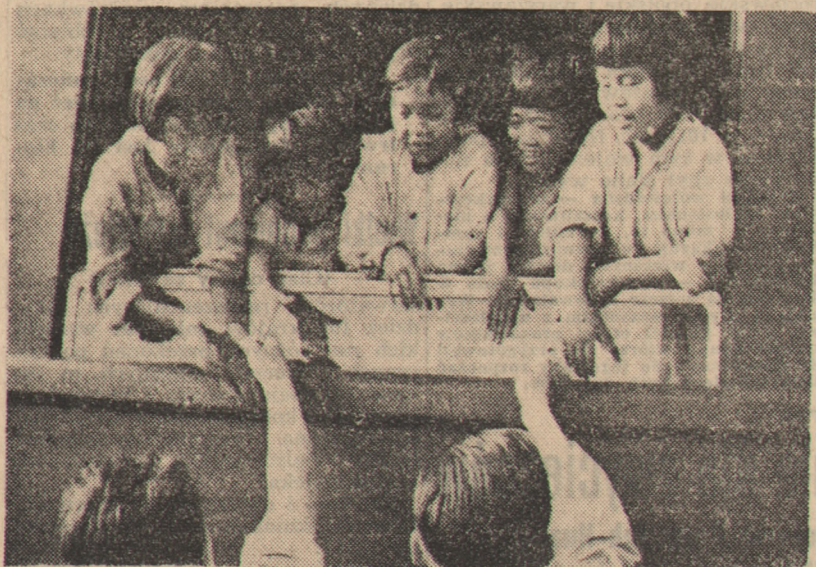
Ostatnio przybyła do Polski na zaproszenie Rządu PRL liczna grupa sierot koreańskich, dzieci poległych żołnierzy koreańskiej Armii Ludowej i ofiar wojny. Zebrana na dworcu w Warszawie młodzież serdecznie powitała przybyłe dzieci koreańskie. (CAF - fot. Dąbrowiecki).

KOMITET CENTRALNY POLSKIEJ ZJEDNOCZONEJ PARTII ROBOTNICZEJ