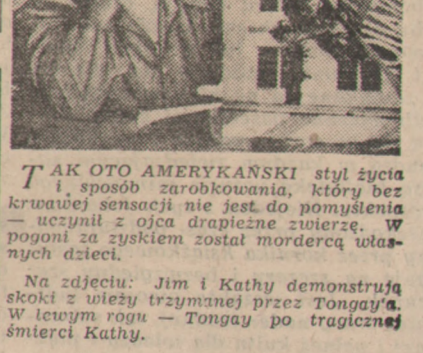
TAK OTO AMERYKAŃSKI styl życia i sposób zarobkowania, który bez kruszej pomocy nie jest do pomysłenia - uczynił z ojca dlapieżne zwierzę. W pogoni za zyskiem został mordercą własnych dzieci.