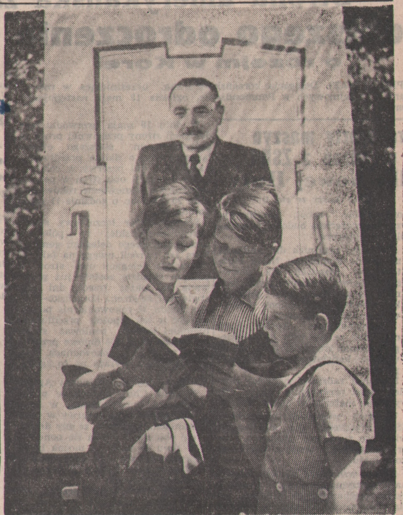
W niedzielę 17 maja rozpoczęły się w całym kraju Dni Oświaty Książki i Prasy — dni wzmożonej pracy nad dalszym umasowaniem czytelnictwa, dni przeglądu dorobku Polski Ludowej na polu oświaty i kultury, dni wzmożonej działalności szerokiego aktywno-kulturalno-oświatowego w jego pracy nad stałym podnoszeniem świadomości politycznej szerokich rzesz społeczeństwa. Na zdjęciu: Młodzież z zainteresowaniem przegląda książki na kiermaszu w Warszawie.

KRAKÓW — NOWA HUTA. Każdy dzień przynosi dalsze dostawy nowoczesnego sprzętu radzieckiego dla kombinatu Nowa Huta. Dostawy te, dostosowane do har-