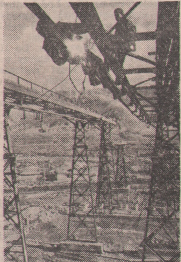
Gigantyczne prace przy budowie kubyszewskiej elektrowni wodnej na Wodzie w ZSRR.