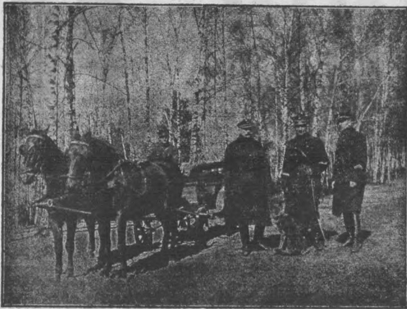
Zdjęcie nasze przedstawia ilustrację granicy Straży Celnej przez organy lustracyjne.

We trzy dni po owym dniu pamiętnym dla panny Klary i pamiętnym także dla pana Pawła, heroina nasza w ślicznym szlafrocuku z obcisłymi rękawami, który nie zakrywał bynajmniej jej kształtów pełnych i urodziwych, z małym kołnierzykiem wyhaftowanym w najdelikatniejsze wzory, z kryzykami, które tem bielszą czyniły jej śnieżną rękę, stała w oknie sama jedna