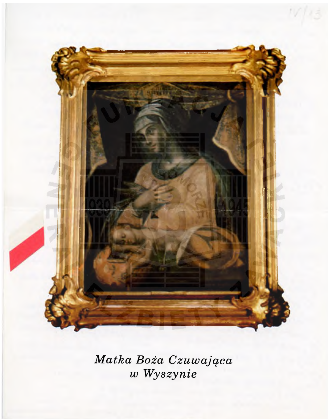
Matka Boża Czuwająca w Wyszynie