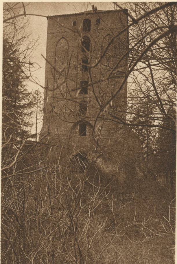
GRUDZIĄDZ I OKOLICA ; Ruiny zamku krzyżackiego w Rogóźnie. Wieża wjazdowa. POLOGNE — GRUDZIĄDZ ET ENVIRONS : Ruines du château de l'ordre teutonique à Rogóźno. POLAND — GRUDZIĄDZ AND NEIGHTOURHOOD : Ruins of castle belonging to the Teutonic-Order in Rogóźno Steeple gate-way.