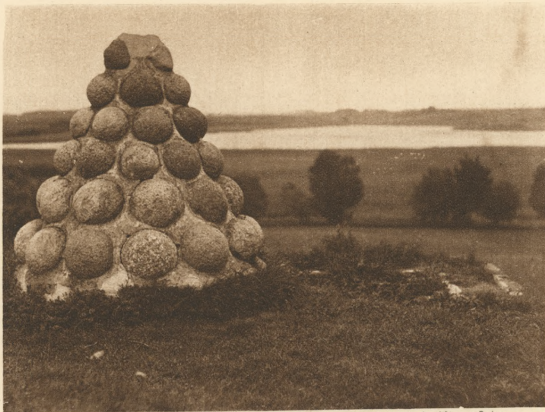
GRUDZIĄDZ I OKOLICA: Piramida z kul granitowych na wałach zamku w Radzynie.

POLOGNE — GRUDZIĄDZ ET ENVIRONS: Pyramide de boulets granitique sur les remparts du château à Radzyn. POLAND — GRUDZIĄDZ AND NEIGHTOURHOOD: E pyramid of granitical balls on the castles ramparts in Radzyn.