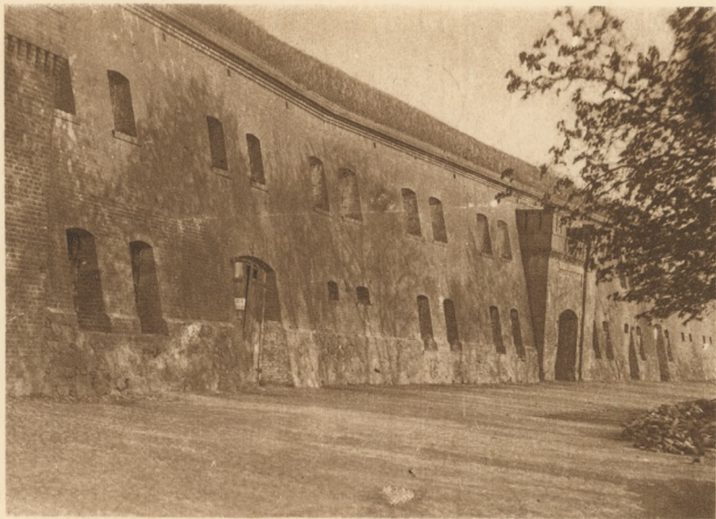
GRUDZIĄDZ: Szczegół fortów Courbiera.

POLOGNE — GRUDZIĄDZ: Detail des forts de Courbiera.