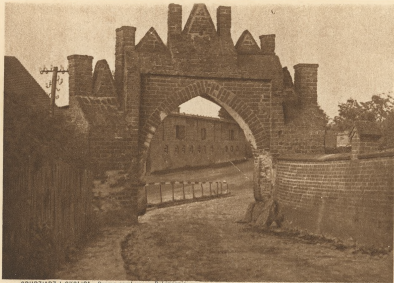
GRUDZIĄDZ I OKOLICA : Brama zamkowa w Pokrzywnie.

POLOGNE — GRUDZIĄDZ ET ENVIRONS : Porte du château à Pokrzywno.