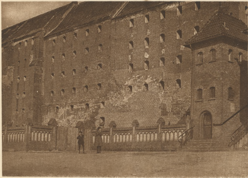
GRUDZIĄDZ: Stare spichrze obronne.

POLOGNE — GRUDZIĄDZ: Anciens magasins de defense.