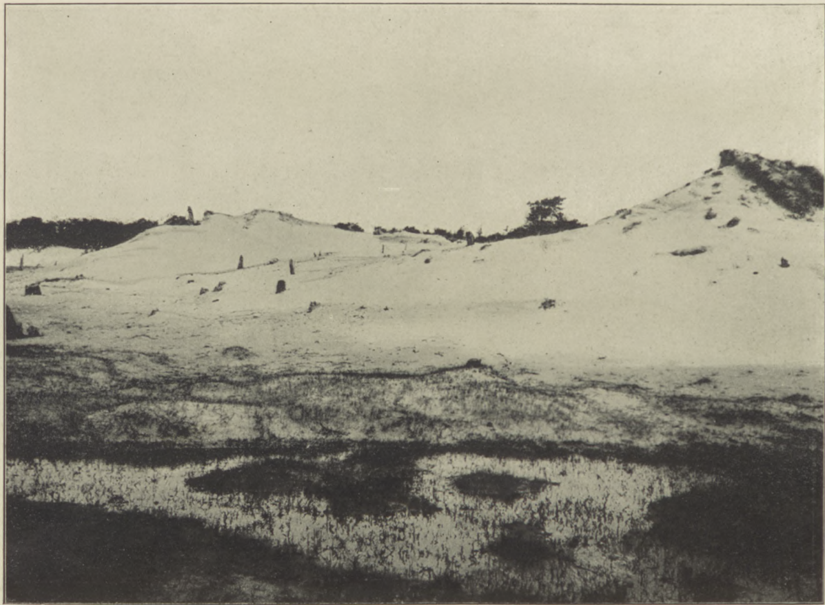
Z OKOLIC POŁĄGI. Ślady zasypanego piaskiem lasu.