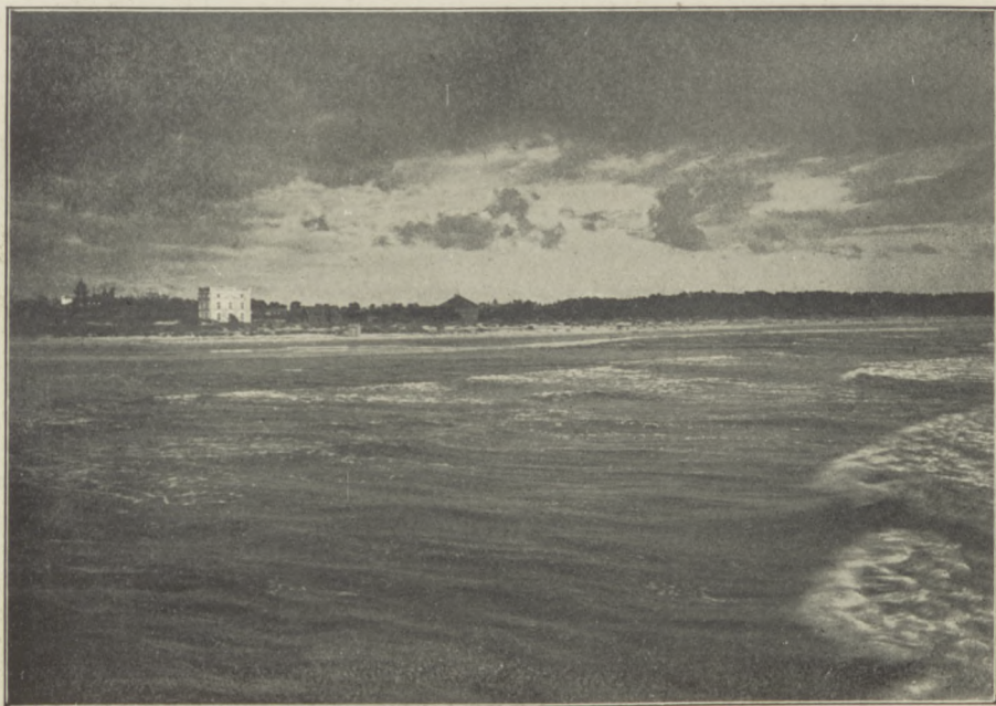
POŁĄGA. Widok od morza na „Komodę”.