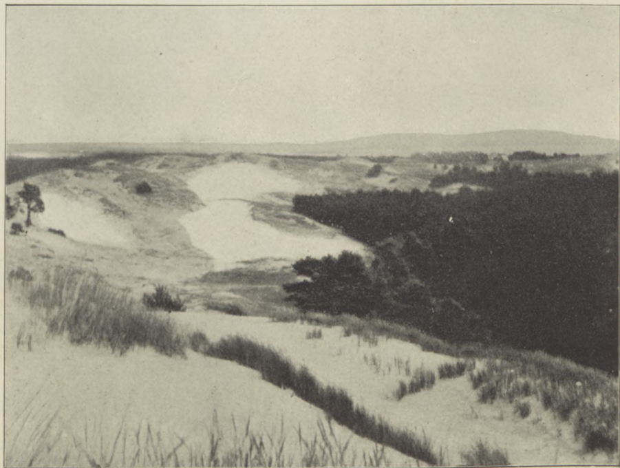
Wydma paraboliczna w pobliżu Rowy.