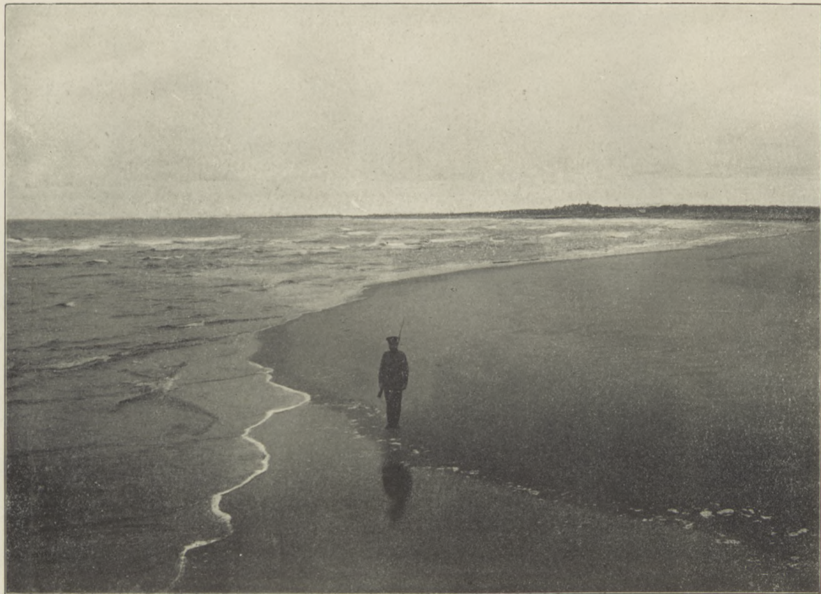
Zatoka pod Holenderską Czapką.