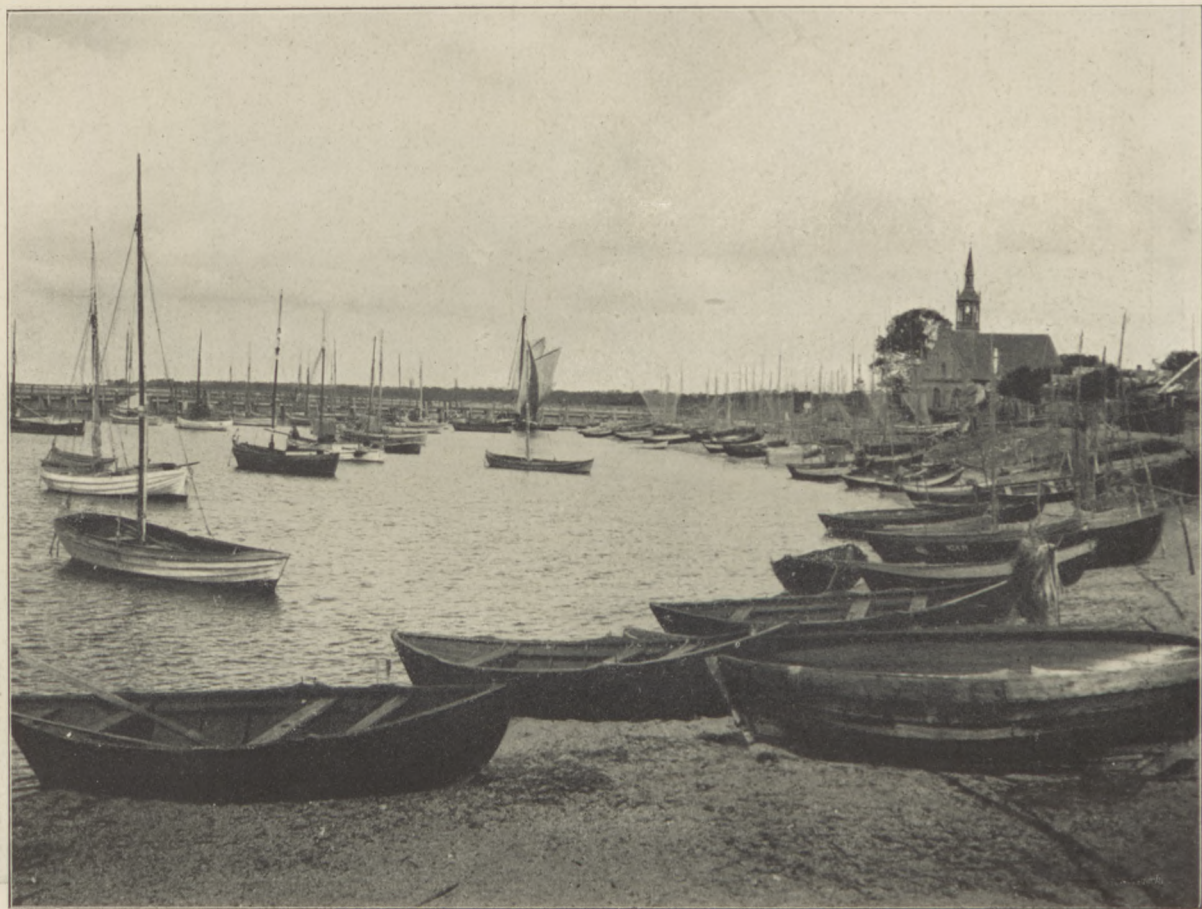
Wielki port rybacki w Helu