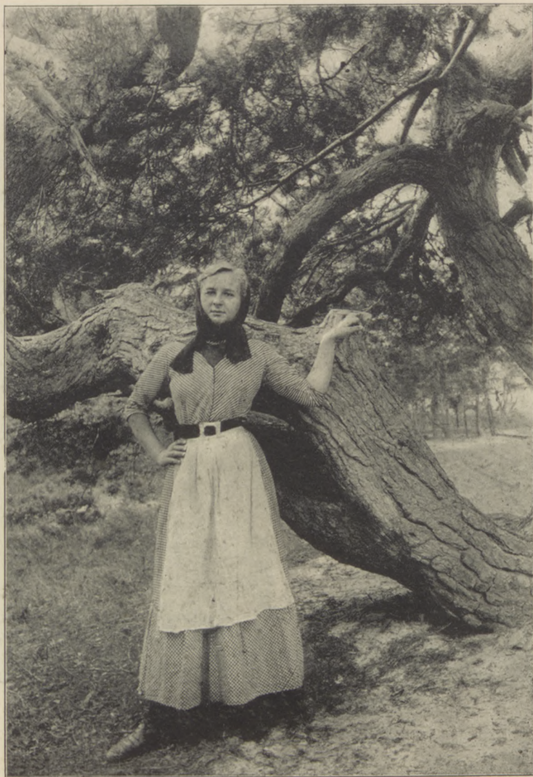
Kaszubka pod sosną nadmorską, potwornie rozwiniętą.