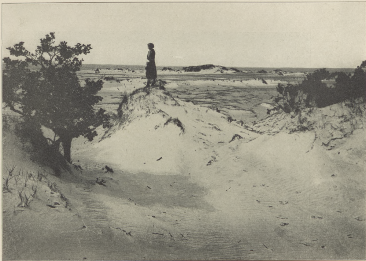
Wśród wydmy nadbrzeżnych pod Połogą.