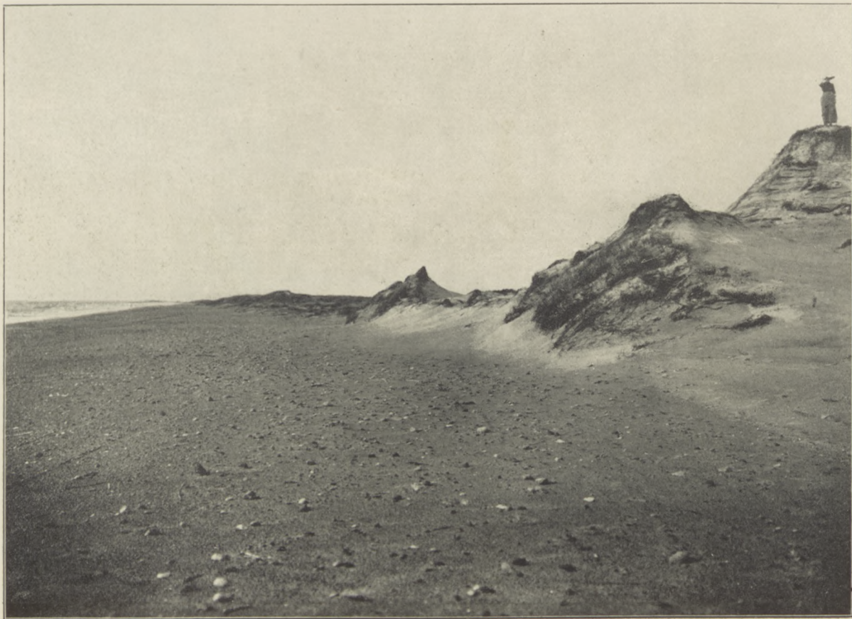
Z OKOLIC POŁĄGI. Szczątki wydm.