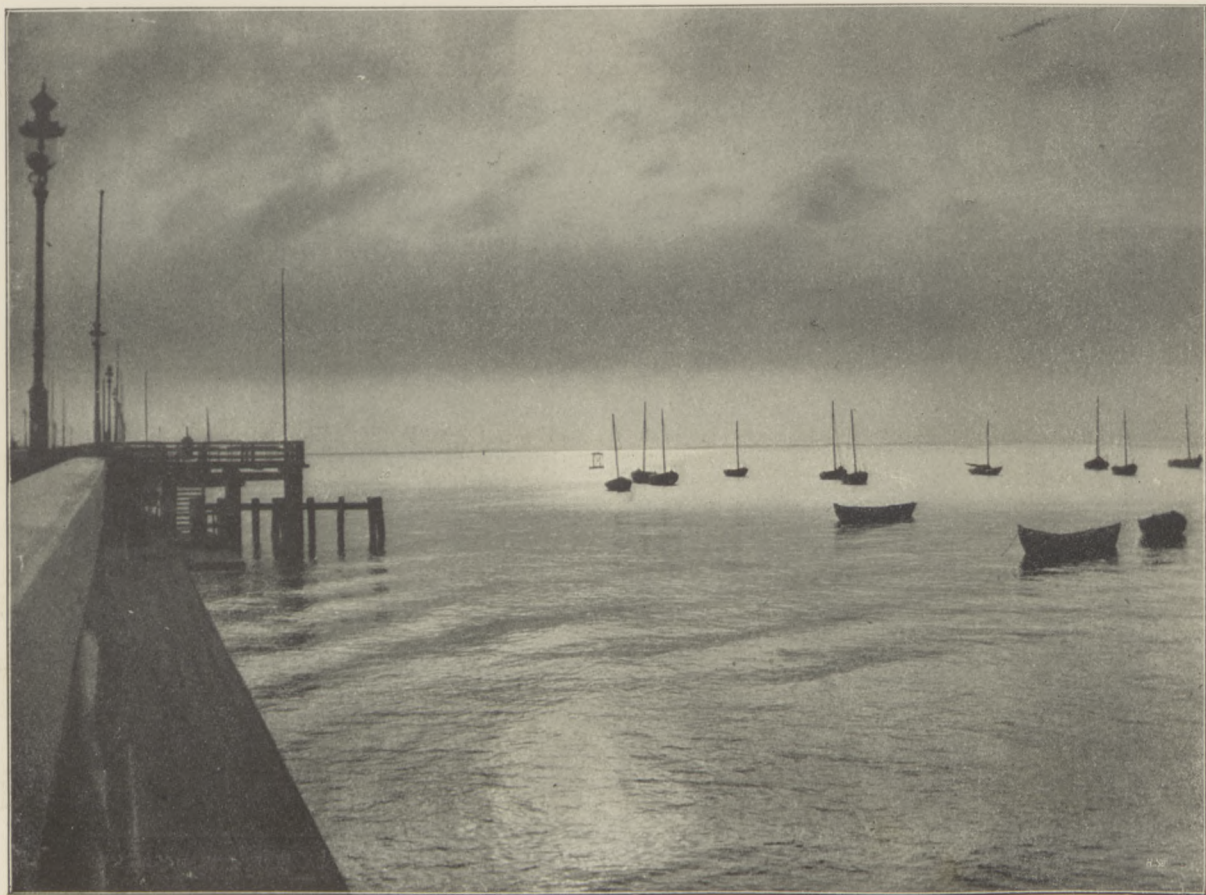
Widok na morze pod Sopotami.