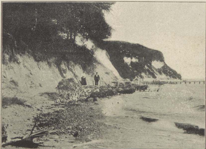
Wybrzeże Rujny koło Gościc.