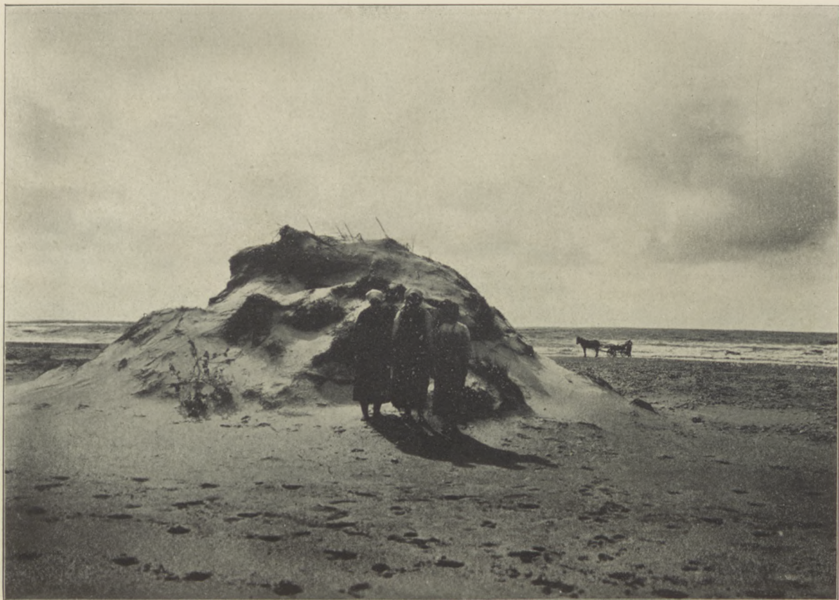
Z OKOLIC POŁĄGI. Szczątki wywianej wydmy.