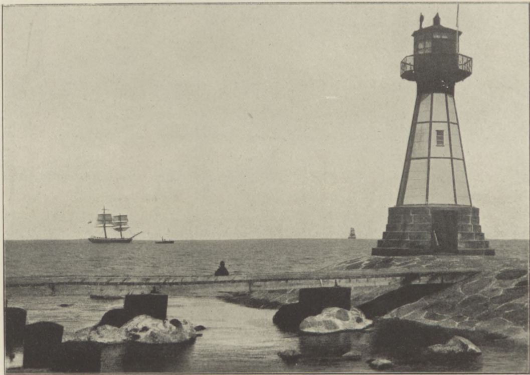
Nowy Port pod Gdańskiem z latarnią morską