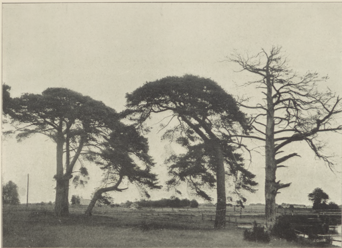
Parasolowate sosny nadmorskie w Rucawie.