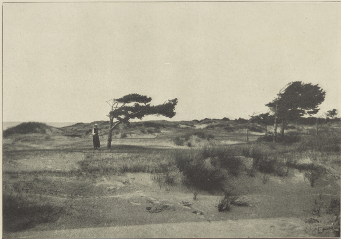
Z OKOLIC POŁĄGI. Wpływ wiatru na kształt sosen nadbrzeżnych.