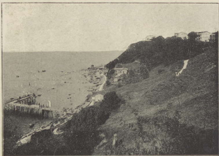
Łomna na Rujnie.