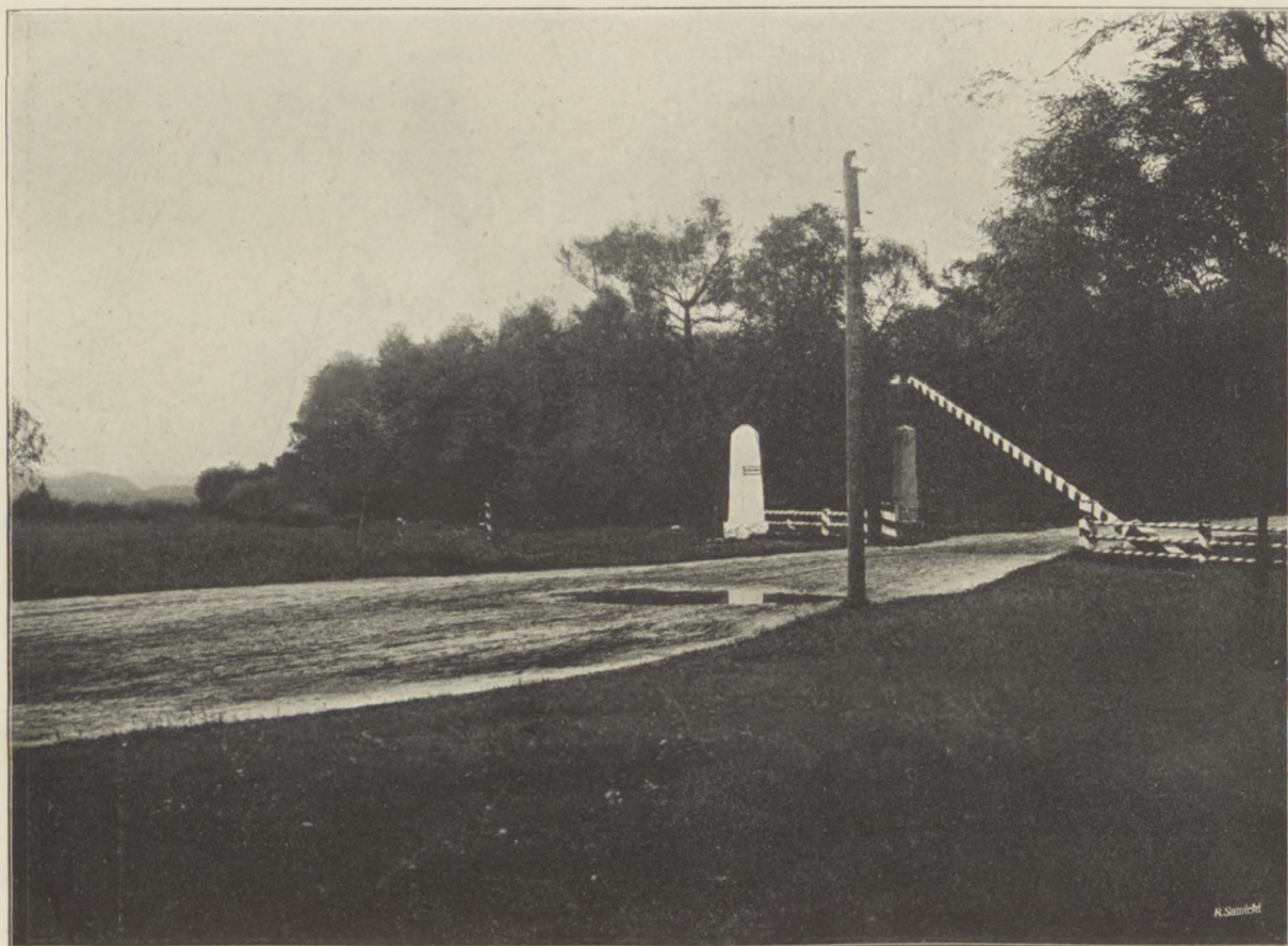
Granica rosyjsko-pruska pod Połogą.