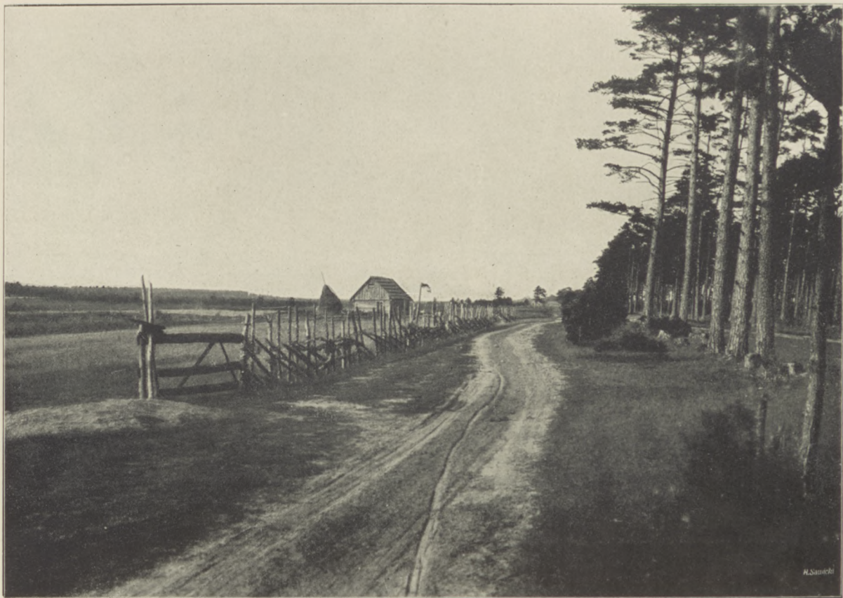
Z OKOLIC POŁĄGI. Droga nadmorska.