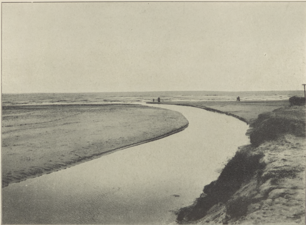
Raża przy ujściu do morza.