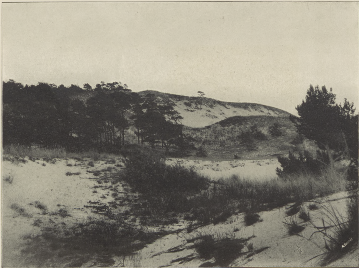
Wydmy pod Borem w okolicy Jastarni.