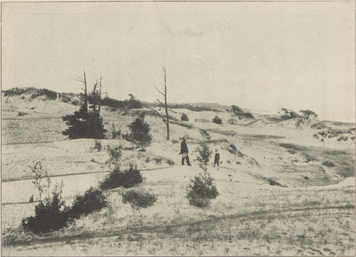
Szczałki zasypanego przez wydmy lasu pod Immersatem.