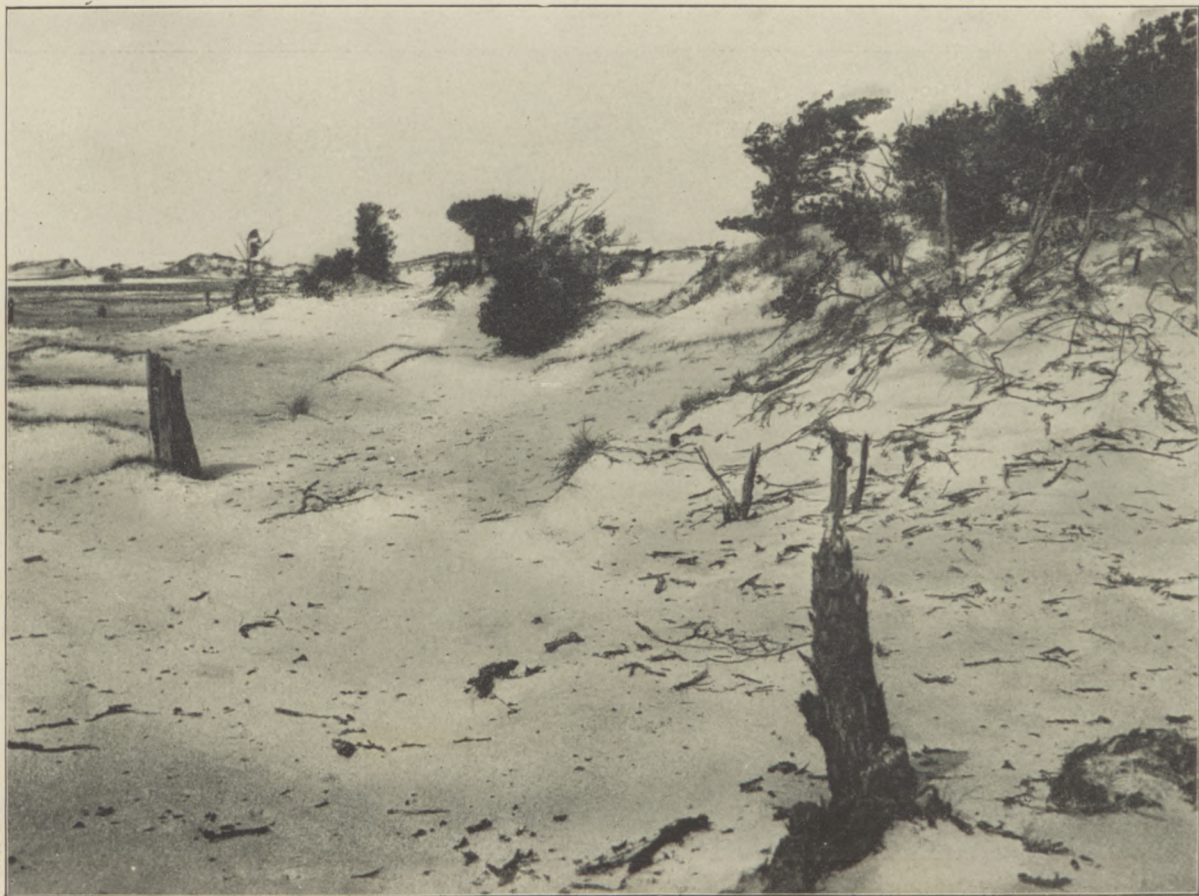
Z OKOLIC POŁĄGI. Krajobraz wydmowy.