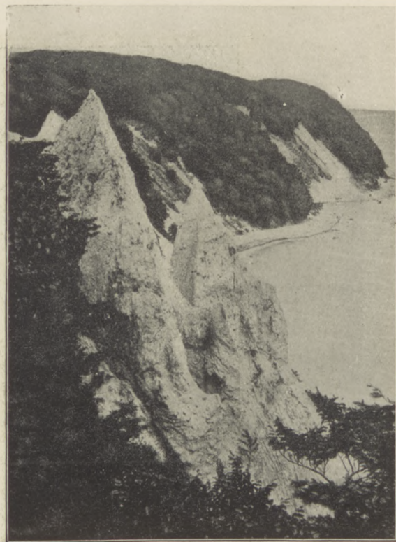
Kredowe brzegi Rujny (Rugii).