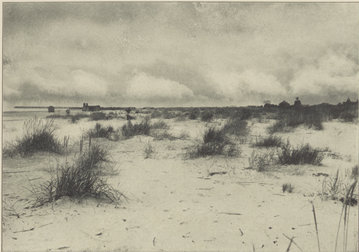
POŁĄGA. Zarośla wydmowe.