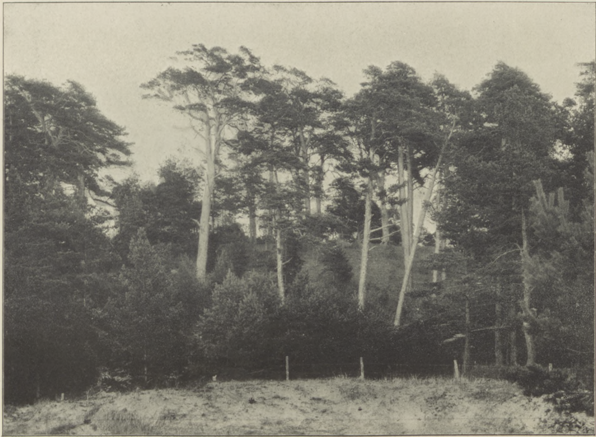
Las na Birucie.