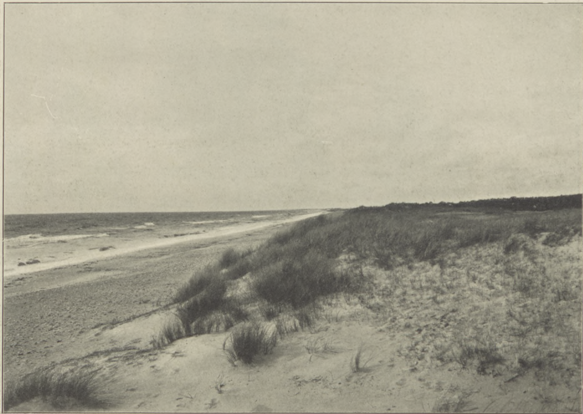
Wybrzeże morskie pod Holenderską Czapką.