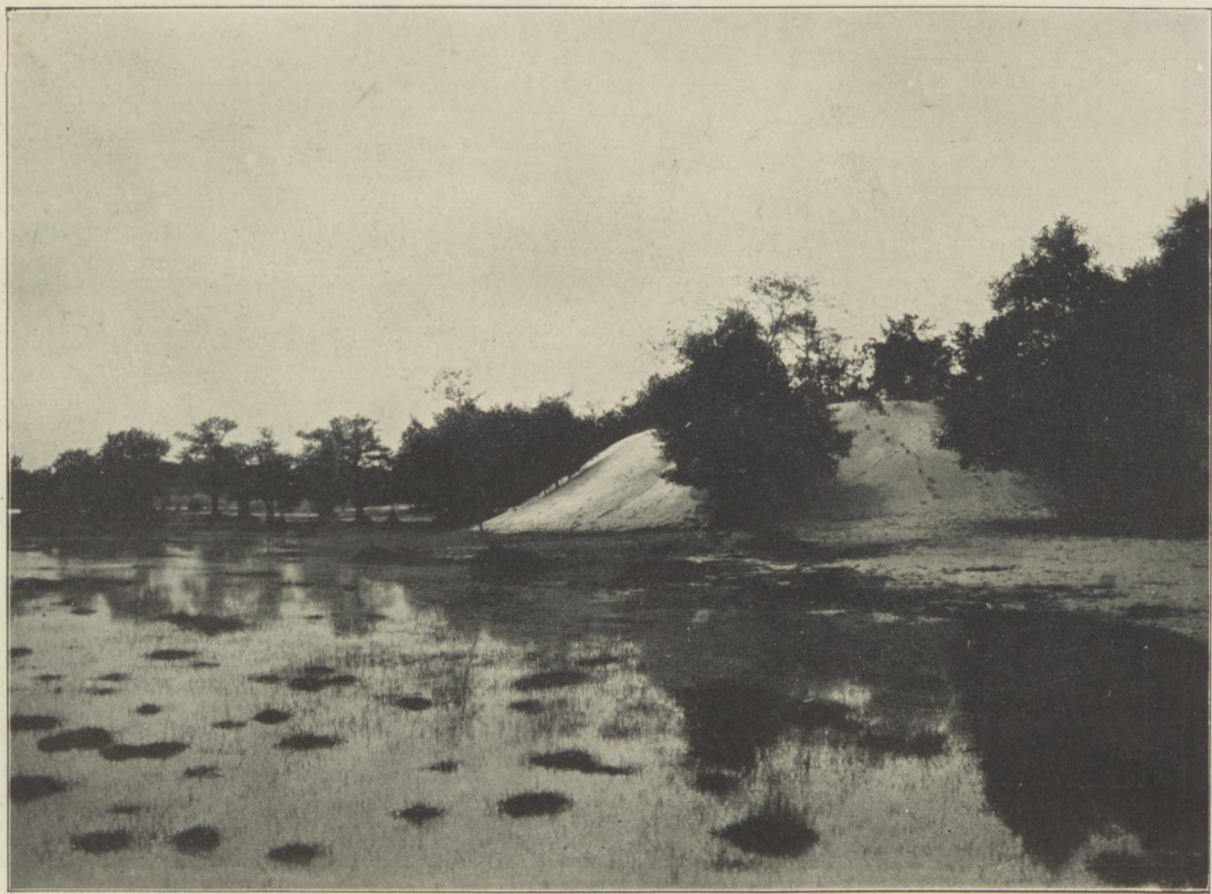
Z OKOLIC POŁĄGI. Wydma wędrująca, wkraczająca w bagno.