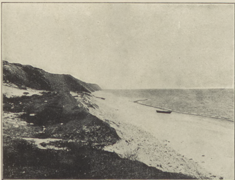
Brzeg pod Rozewiem.