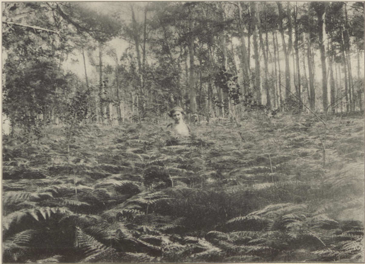
Zarośle paproci na mierzei pod Jastarnią.