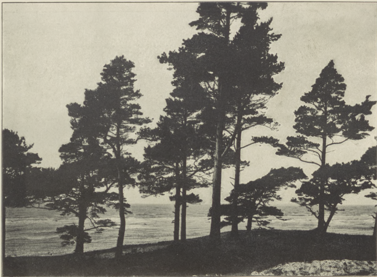
Widok na morze z Holenderskiej Czapki