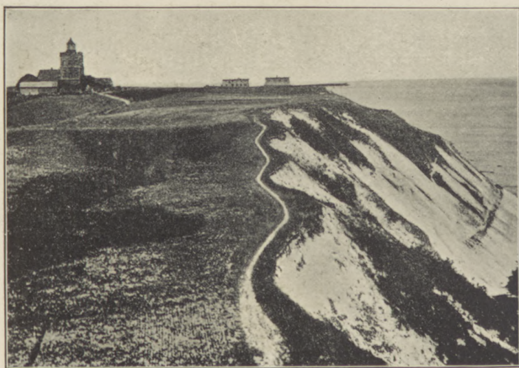
Arkona z latarnią morską.