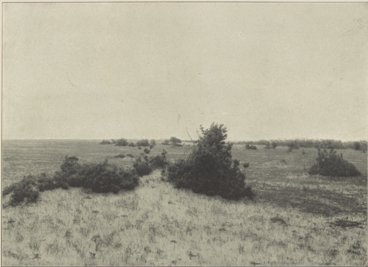
Sośnina karłowata na piaskach nadbrzeżnych pod Holenderską Czapką.