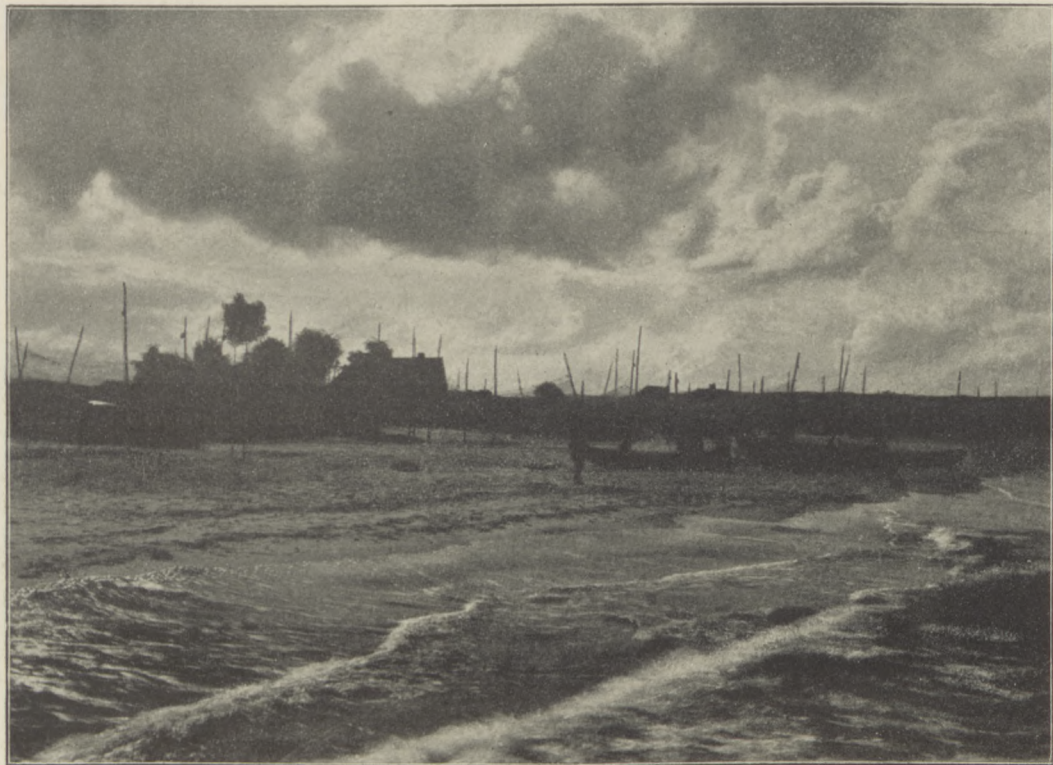
Gdynia pod Gdańskiem.