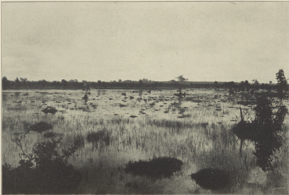
Z OKOLIC POŁĄGI, Bagniska poza pasmem wydm nadbrzeżnych.