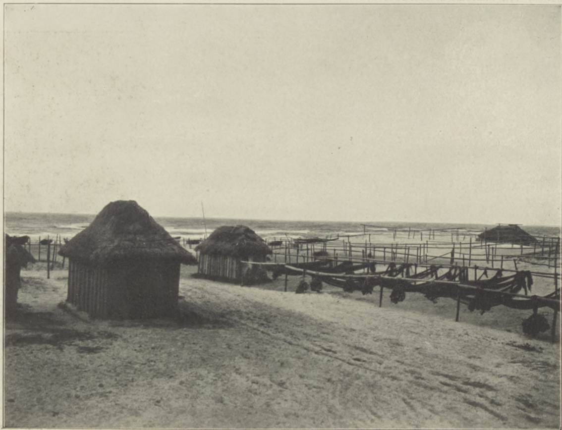
Z OKOLIC POŁĄGI. Sieci i przyrządy rybackie.