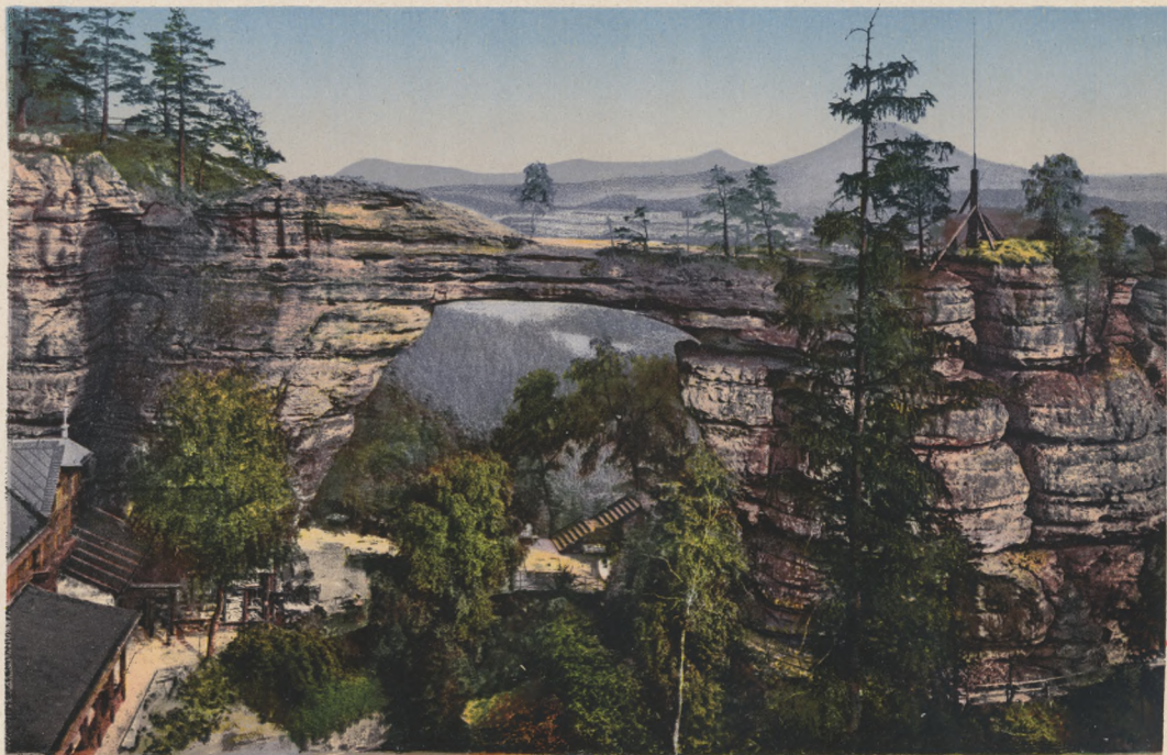
Böhm. Schweiz. Prebischtor.