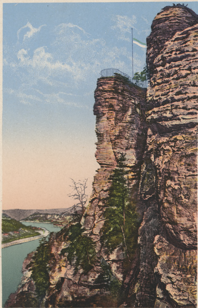
Sächs. Schweiz. Basteifelsen mit Elbtal.