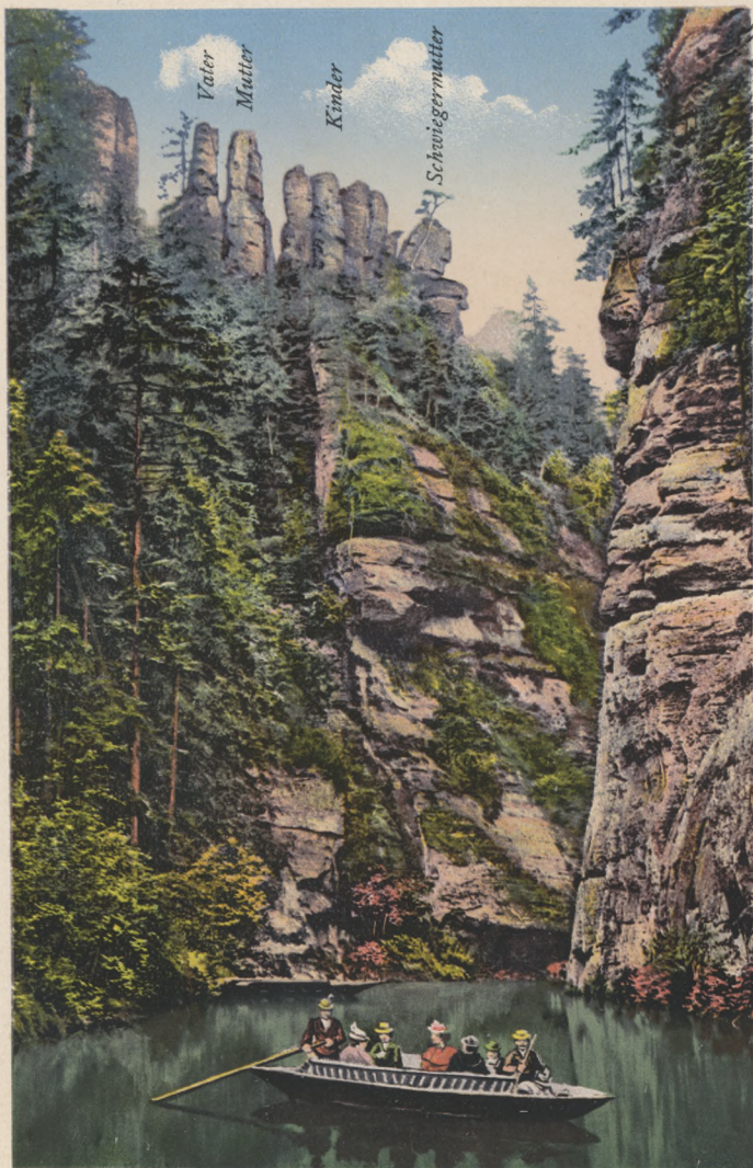
Böhm. Schweiz. Edmundsklamm-Familie.