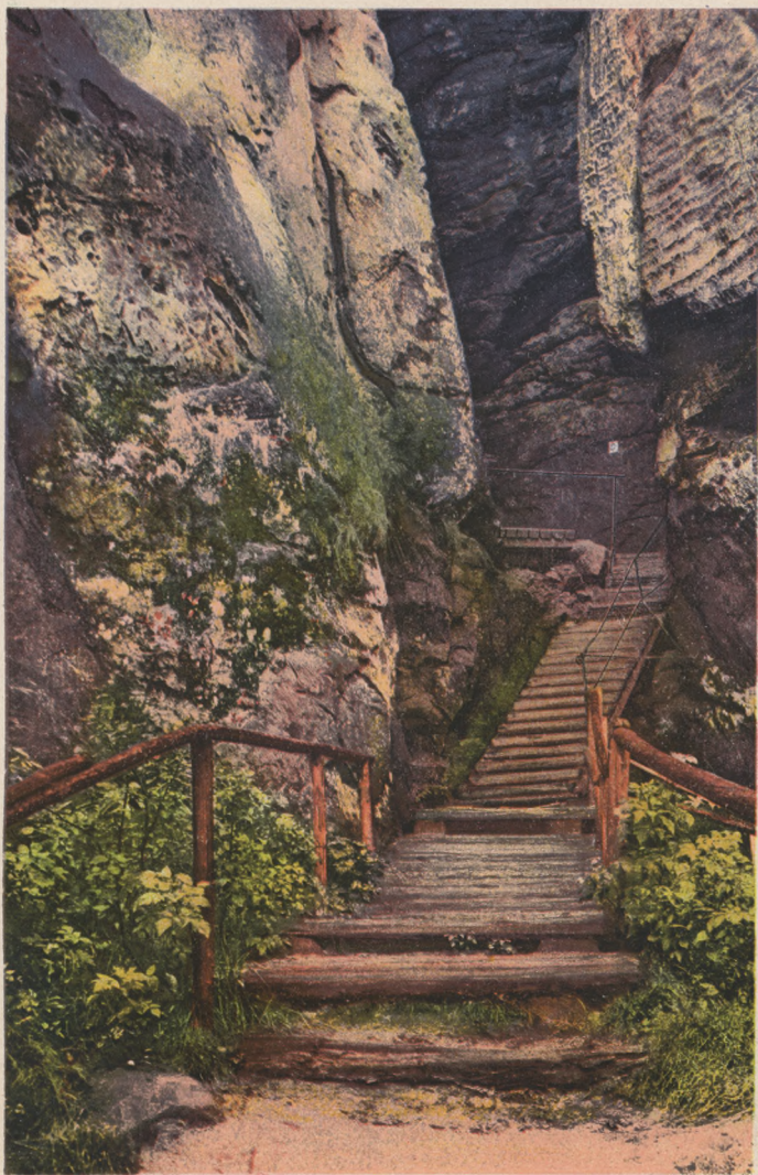
Sächs. Schweiz. Schwedenlöcher — Rathen.