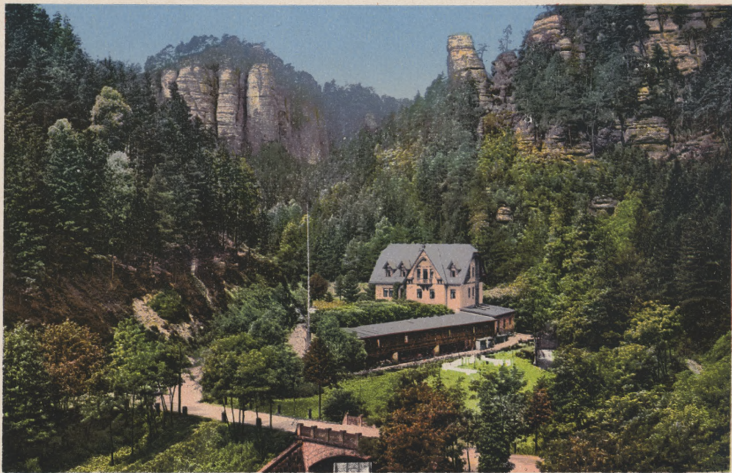
Sächs. Schweiz. Polenztal mit Restaurant Waltersdorfer-Mühle und Talwächter.