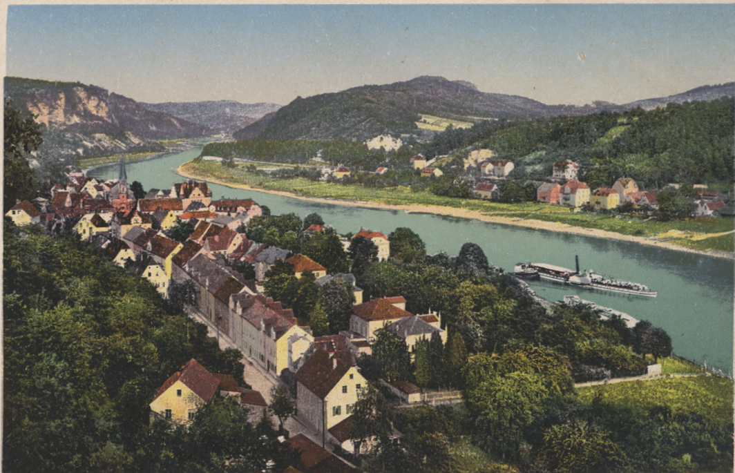
Sächs. Schweiz. Wehlen und Pötzscha.