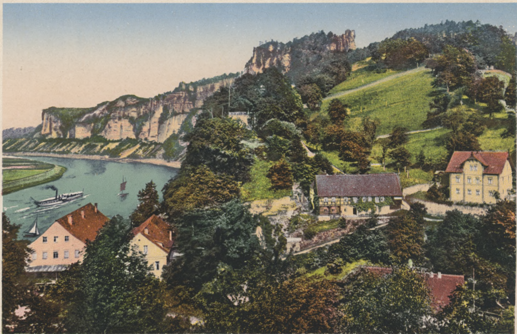
Sächs. Schweiz. Rathen mit Elbtal und Bastei.