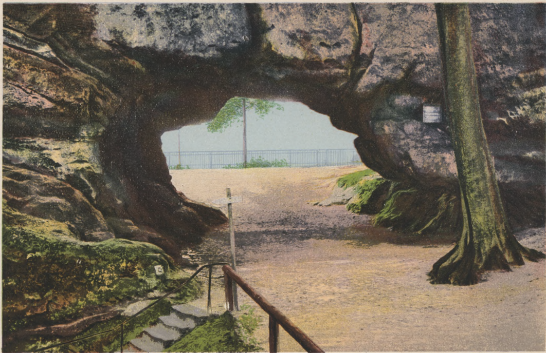
Sächs. Schweiz. Kuhstall.