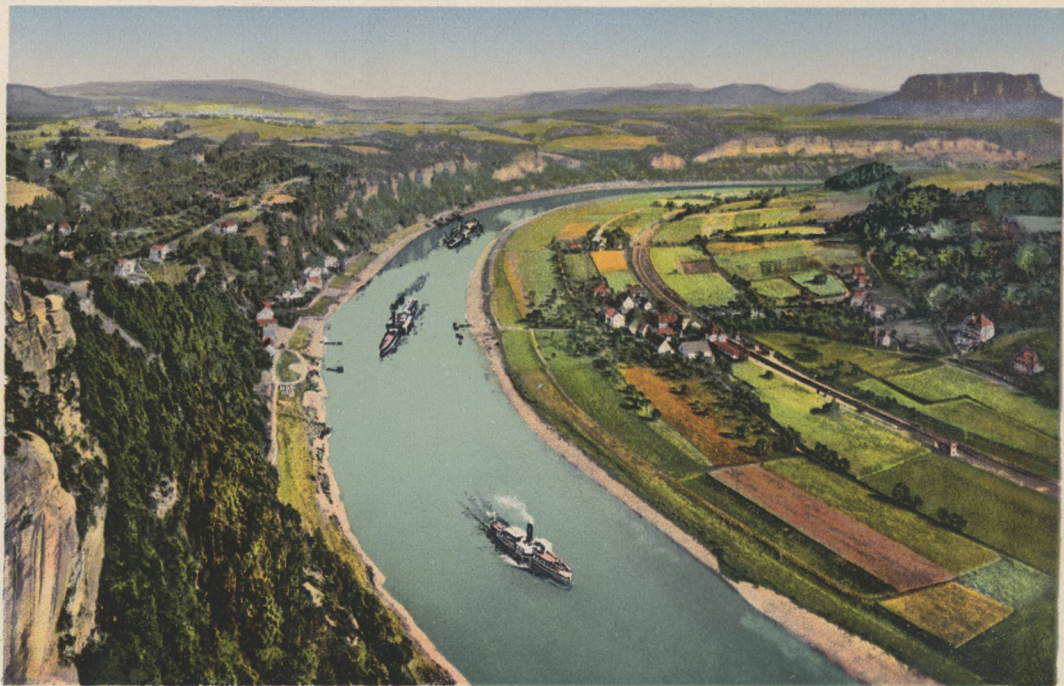
Sächs. Schweiz. Blick von der Bastei auf Rathen, Elbtal und Lilienstein.