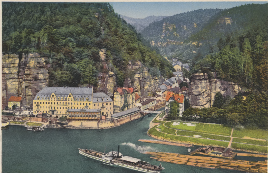
Böhm. Schweiz. Herrnskretsch.