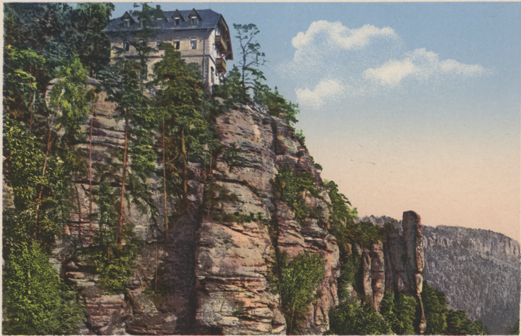
Sächs. Schweiz. Brand-Hotel.