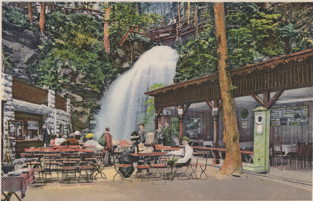
Sächs. Schweiz. Amselfall — Rathen.