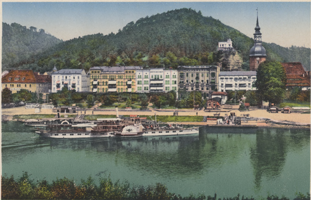
Sächs. Schweiz. Schandau.