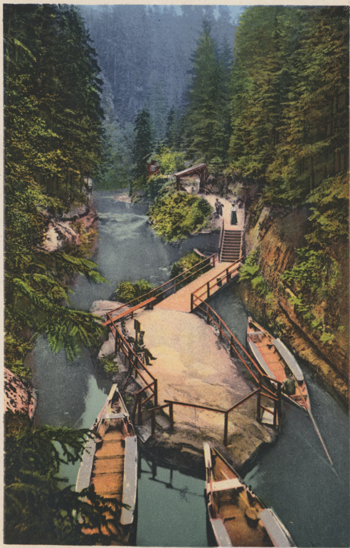
Böhm. Schweiz. Edmundsklamm, Breiter Stein.