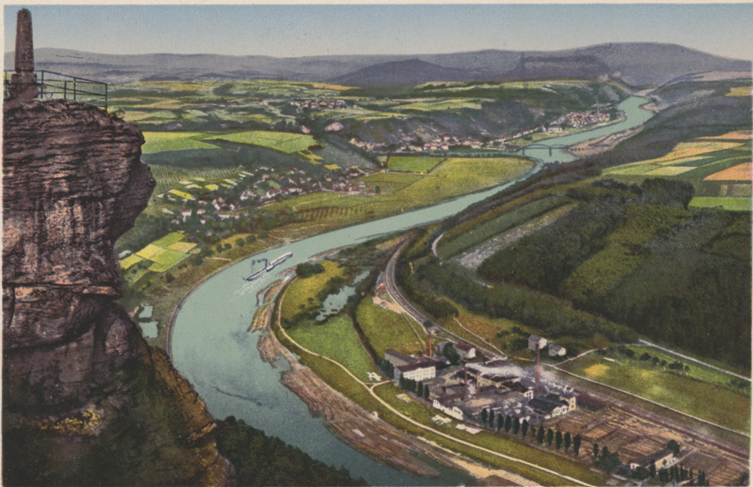
Sächs. Schweiz. Elbtal, Schandau und Großer Winterberg vom Lilienstein aus gesehen.