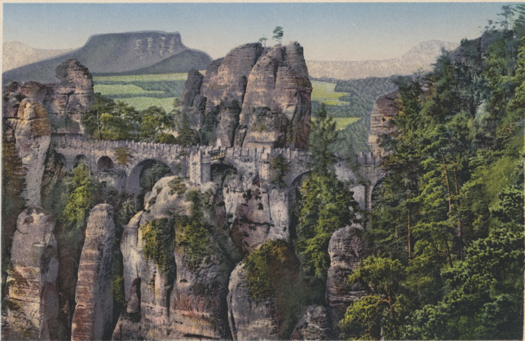
Sächs. Schweiz. Basteibrücke.