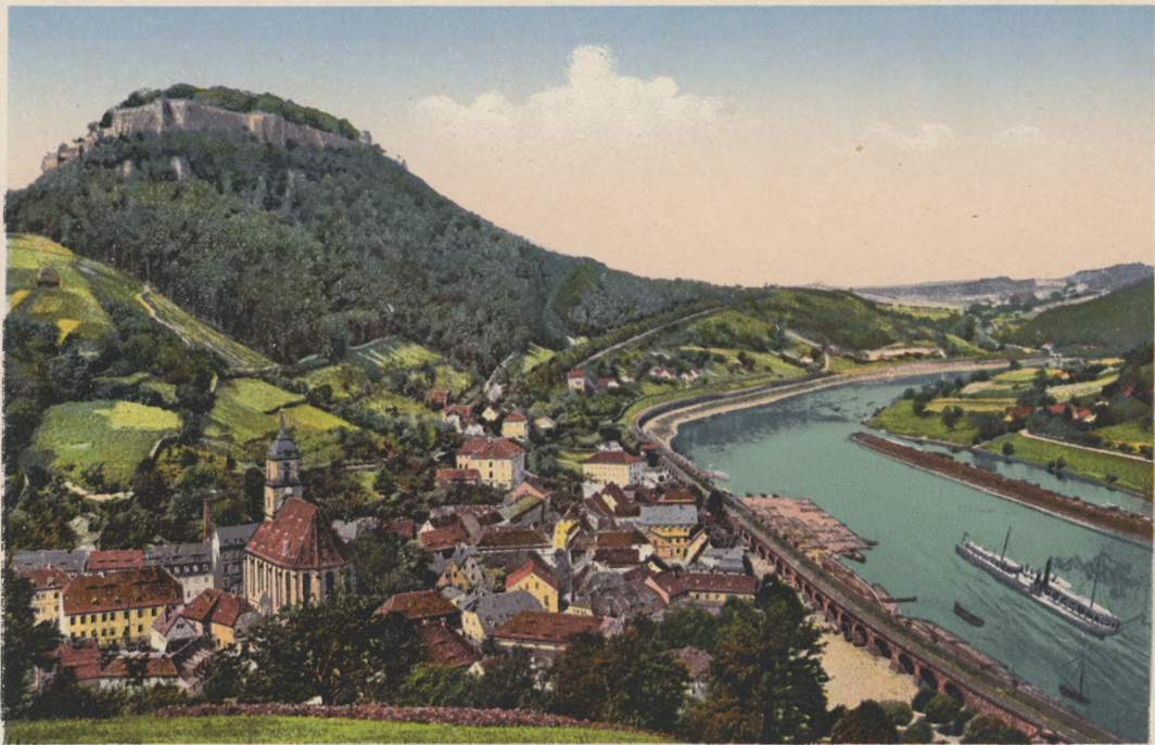
Sächs. Schweiz. Königstein mit Festung.