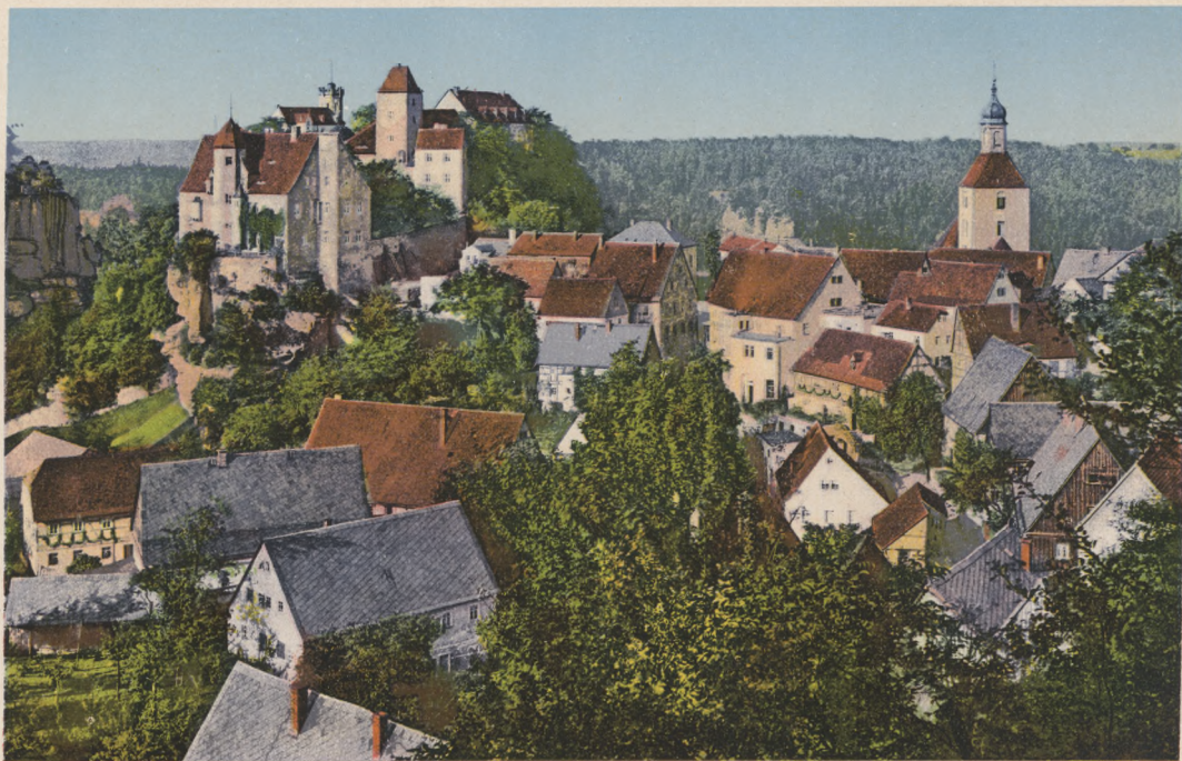
Sächs. Schweiz. Hohnstein mit Schloß.