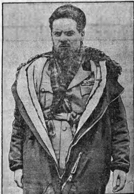
Włoski minister lotnictw Italo Balbo, czyni ostatnie przygotowania do lotu transatlantyckiego do Południowej Ameryki. Udział w locie weźmie 12 wodno- pławców. Na całej trasie lotu patrolować będą włoskie okręty wojenne, by wraz z nieszczęśliwego wypadku móc po- spieszyć z pomocą.

Przyjmuję do szycia nowo- i przerabiam stare kołdry „Pracownia Warszawska” ulica 20 Stycznia 13 parter