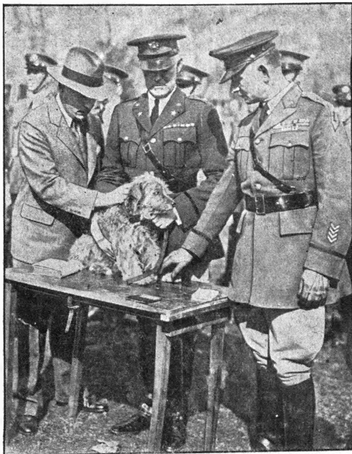
Oficerowie amerykańskiej dywizji z nsem, który towarzyszył im na placu boju w czasie wojny światowej.

8) W Komisji Obwodowej Nr. 100 był przewodniczącym N. Nalepa, urzędnik Izby Skarbowej i podobno komendant „Strzelca”. Rezultaty głosowania były następujące: na 1.318 uprawnionych do głosowania oddało głosów według jednego spisu wyborców 1.070, według drugiego 1.187, a z urny wyjęto 1.261 kopert z oddanymi głosami. 49 osób nie mogło spełnić prawa głosowania, albowiem już przedtem podstawieni ludzie za nich głos oddali.