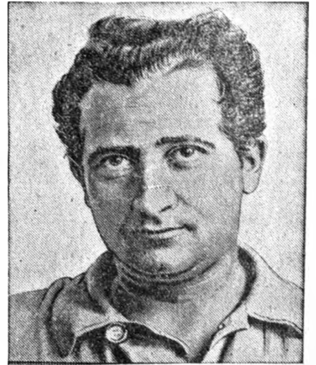
Lotnik transatlantyk mjr. Franco. zbiegł z więzienia wojskowego w Madrycie (stolica Hiszpanji), w którym spędził kilka miesięcy. Do więzienia słynny lotnik hiszpański dostał się za agitację republikańską.

W Kleinleipisch (Saksonja) wydarzyła się katastrofa w kopalni „Marjanna“. Załamał się most dźwigowy (górne zdjęcie, dokonane przed katastrofą). Podczas katastrofy śmierć pod ciężką konstrukcją znalazło 7 monterów, zaś 16 odniosło ciężkie rany. Załamanie się konstrukcji nastąpiło bowiem podczas montażu. Na kopalni tej już raz załamał się most dźwigowy. Było to przed 2 laty. Z czasu tego pochodzi dolna fotografia.