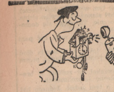
A teraz usłyszycie głos pierwsze kukulki. („Berliner Illustrierte”)