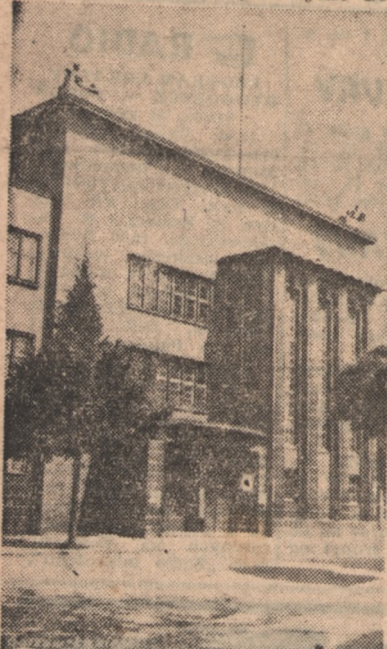
Gorzów posiada wiele nowoczesnych budynków użyteczności publicznej. Jednym z nich jest Łaźnia Miejska.

Odległy o ponad sto kilometrów od Zielonej Góry Gorzów nie jest siedzibą województwa, ale współzawodnicznikiem tych miast we wszystkich dziedzinach życia, scementowuje coraz bardziej oba miasta ze sobą a całe województwo z Macierzą, do której powróciło ono po odzyskane nowe życie.