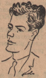
IGOR OJSTRACH (ZSRR)

urodzila się w 1928 roku w Kijowie w rodzinie robotniczej. Od 8 roku życia życia rozpoczęła naukę w szkole muzycznej w klasie skrzypcowej. W 1944 r. wstępuje do Kijowskiej Szkoły Muzycznej na kurs czwarty. W 1945 r. zdobywa pierwszą nagrodę i zaszczytny tytuł laureata Ogólnoukraińskiego Konkursu Muzyków-Wykonawców. W rok później rozpoczyna studia w konserwatorium, a w 1950 r. przenosi się do Moskwy na czwarty kurs Konserwatorium Moskiewskiego, gdzie obecnie studiuje na piątym roku w klasie prof. D. F. Ojstracha.