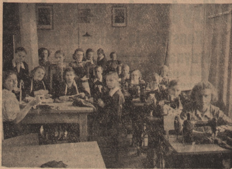
W pracowni krawieckiej szkoły zawodowej dla głuchoniemych