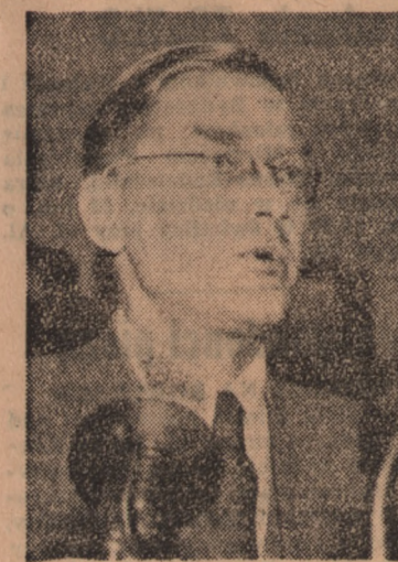
Przewodniczący Rady Państwa