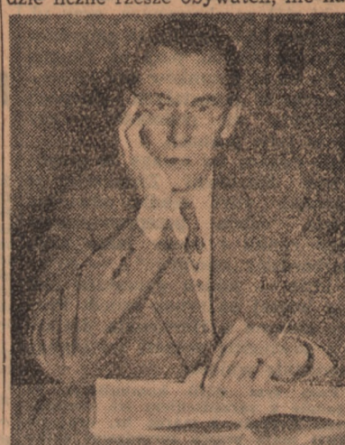
Bolesław Bierut, poseł na Sejm, przedstawiciel Frontu Narodowego.

Te trzy aspekty: jedność narodu polskiego, oparcie budownictwa państwowego na podstawach naukowych i obrona pokoju świata, to trzy główne podstawy działalności naszego Państwa Ludowego i Wysoka Izba, oddając jednogłośnie swe głosy na przedstawiciela tych właśnie kierunków, raz jeszcze dała dobitny wyraz jedności narodu polskiego w dziele budowy ustroju sprawiedliwej społecznej. To chciałbym wyraźnie podkreślić. (długotrwałe oklaski)